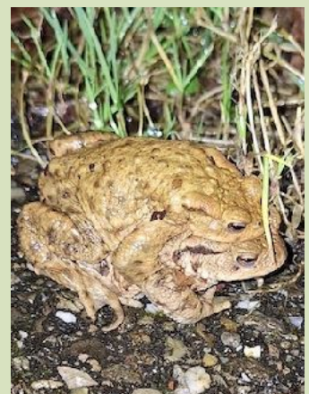
Gewone pad man en vrouw

Meer informatie over de amfibieëntrek en ook de praktische informatie over hoe zo'n overzetavond verloopt, vind je op de websites van IVN Assen en KNNV Assen onder de kop 'Werkgroep amfibieën en reptielen'.