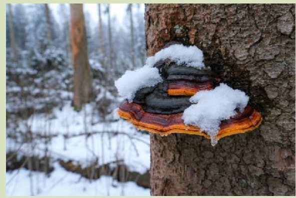
Roodgerande houtzwam

De wandeling start om 13.00 uur op de grote parkeerplaats met informatiebord in de bocht aan de Houtvester Jansenweg tussen 't Nije Hemelriek en Eexterhalte. Na ongeveer 2 uur kom je weer terug bij het beginpunt. Deelname kost € 2,50 voor leden van IVN-KNNV en € 5,00 voor niet-leden.