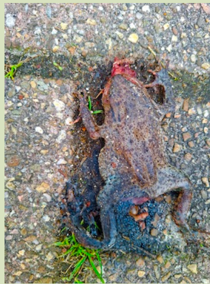
Gewone pad, vrouwtje doodgereden