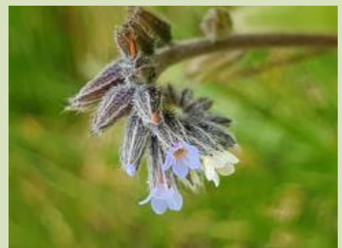
Veelkleurig vergeet me nietje