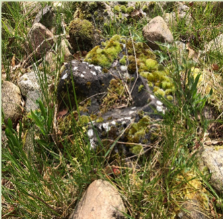
Steen met diverse mossen

Afgelopen zaterdag 18 maart en woensdag de 12 e april waren we weer actief in de DCA-tuin. In maart zouden we in het kader van het Oranjefonds starten met de werkzaamheden op 11 maart, maar de weergoden waren ons niet gunstig gezind. De dag ervoor had het gesneeuwd en gevoren, er lag dus een pak sneeuw! Een week later hadden we meer geluk, 't was droog en een zonnetje kwam zo nu en dan kijken. De conditie van de tuin viel ons erg mee, wel waren er veel uitgebloeide planten met lange stelen met zaaddozen. Een goed teken, hopelijk zal dit jaar veel zaad ontkiemen zodat de tuin steeds meer bloemen heeft. Er is veel blad geharkt, veel stengels zijn geknipt en gras is verwijderd. Joop en Geke hadden verschillende plantjes uit hun eigen tuin meegenomen en hebben deze een plekje gegeven.