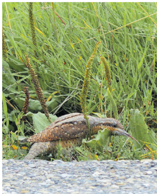
Let op de bruine tong van de draaihals.

In Drenthe werden 86 territoria van draaihalzen gevonden, alleen al in het Drents-Friese Wold 38. Dan moet het wel goed gaan met het voedselaanbod. Een draaihal broedt in hollen van oude verrotte loofbomen, vooral in berken. Zwarte wegmieren zijn zijn favoriete voedsel. Hij zoekt ze langs wegranden, in tuinen en boomgaarden en in akkerlanden die zijn ingezaaid met bloemen. In de holte van een dode boom legt het vrouwtje rond de 10 eieren. Vinden draaihalzen voldoende geschikte oude nestbomen en verregenen mierennesten niet in kletsnatte zomers, dan hebben deze vogels alle kansen te overleven. Er zijn nog geen gegevens bekend over 2022,