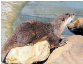
Otter in wethouder Nooterhof in Zwolle.

Met de geur van otterspraint in de neus werd de groep verdeeld en trokken de speurders het veld in om het geleerde in praktijk te brengen. Van Dassenwerkgroep Zuid-Drenthe waren drie leden aanwezig. Ze kozen voor het Oude Diep bij de VAM-berg en de Oude Kene ten