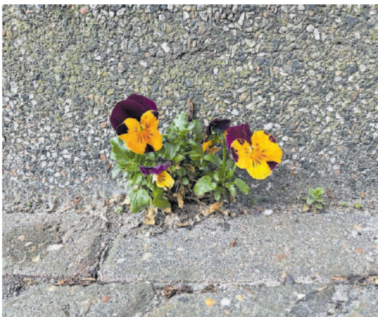
Violtjes tussen de tegels.