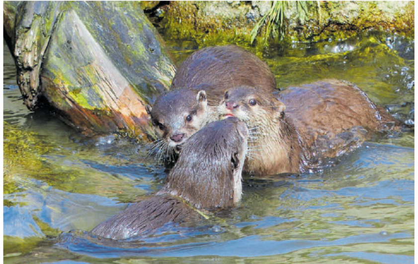
Spelende otters in Natuurpark Lelystad.

Willem Dijkers was onderwijzer aan Het Slood, maar jaagde voor