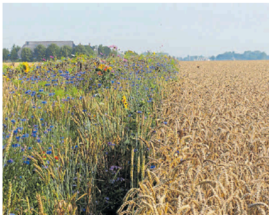
Akkerrand langs tarweveld.

Bij het zien van de vogel op de grond verwonder je je over de vele schakeringen bruin op het verenkleed. Inderdaad, op de schors van een eik zal je hem over het hoofd zien. Op het moment overwinteren draaihalzen in Afrika ten zuiden van de Sahara. Deze maand keren ze naar hun broedgebieden terug. Een deel trekt dan 's nachts over ons land naar Scandinavië. Naar verwachting zullen we deze bijzondere vogel in 2023 opnieuw veel kunnen zien.