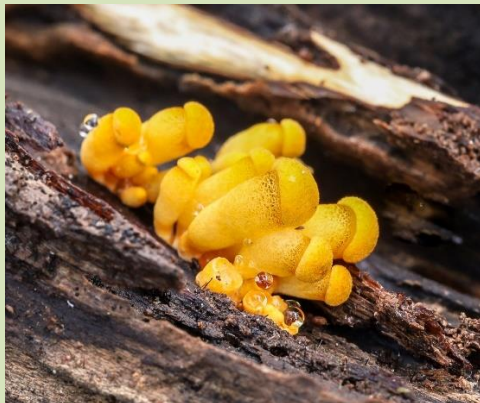
Oranje oesterzwam (?) Frank Huisman