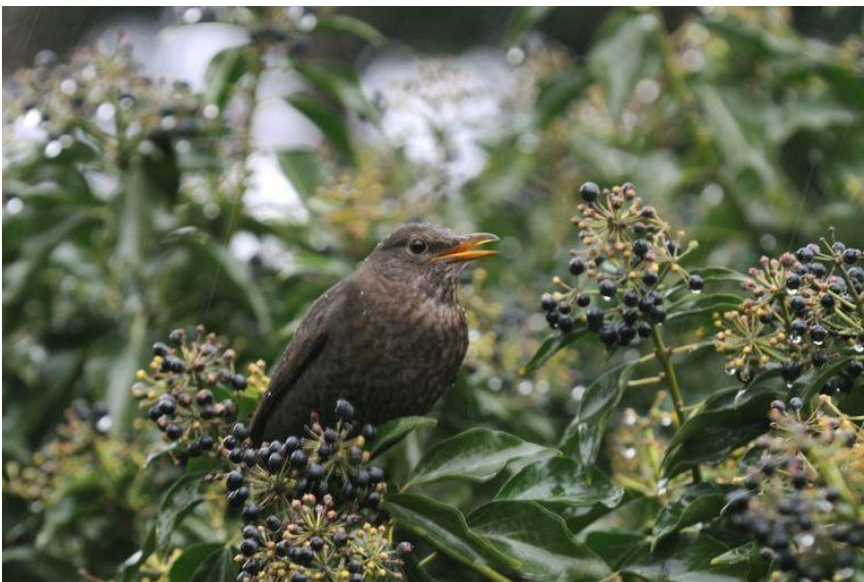
Merel omringd door voedsel en veiligheid in de winter (Bron: Piet Munsterman).

Als je een klimop eens goed bekijkt, dan zal je zeker iets opvallen. Er zitten namelijk verschillende soorten bladeren aan. Dat heeft alles te maken met de levensfase van de plant. De 'jeugdvorm', of vegetatieve fase, is de klimop die je het vaakst ziet, kruipend of klimmend tegen muren en bomen. De bladvorm is handvormig, meestal met drie tot vijf lobben. De kleur van de bladeren is donkergroen en de takken waar ze aan zitten maken hechtworteltjes om te klimmen. In deze fase bloeit de klimop niet. Dan is er de volwassen vorm, met een generatieve fase. Deze verschijnt pas wanneer de plant ouder is. De bladvorm is dan ovaal tot ruitvormig, zonder lobben, vaak iets dikker en lichter groen. Het zijn deze bladeren waartussen je nu de trossen zwarte bessen aan kan treffen. Op bovenstaande foto kan je de twee fasen goed herkennen.