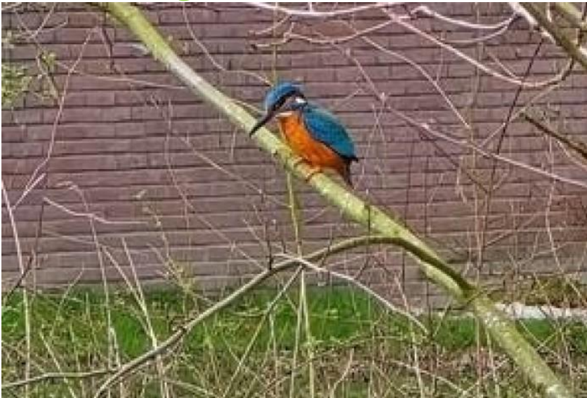
Een Ijsvogel in Waterwingebied Amersfoort

Midden tussen de Amersfoortse wijken Liendert en Rustenburg ligt een verrassend natuurgebied: het Waterwingebied. Hier leven onder meer de Ijsvogel en Sperwer, de Kleine vuurvlinder en de Blauwe breedscheenjuffer. Maar wat komt er nog meer voor? Dat onderzochten leden van de Amersfoortse afdeling van de Koninklijke Nederlandse Natuurvereniging (KNNV) het afgelopen jaar. Op 7 april presenteren zij hun bevindingen tijdens een lezing van de Werkgroep Natuurlezingen Amersfoort.