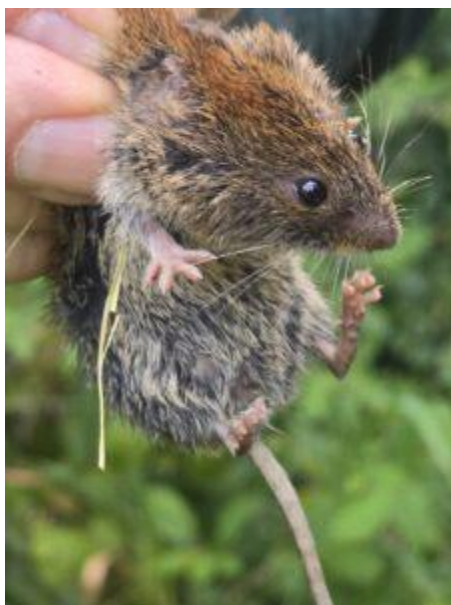
Een Rosse woelmuis in Waterwingebied Amersfoort

De KNNV-afdeling Amersfoort e.o. kiest jaarlijks een zogenoemd adoptieterrein, waar alle werkgroepen veldonderzoek doen. In 2025 was dat het Waterwingebied aan de oostkant van Amersfoort. Het gebied is eigendom van en wordt beheerd door de gemeente Amersfoort, in nauwe samenwerking met bewoners die zijn georganiseerd in de Vereniging Vrienden van het Waterwingebied. Een jaar lang onderzochten KNNV-leden op verzoek van de Vrienden van het Waterwingebied (korst)mossen, amfibieën, vogels, (kleine)zoogdieren, nacht- en dagvlinders en overige insecten, vleermuizen en paddenstoelen. Daarbij zijn opvallend veel bijzondere soorten aangetroffen. Voorafgaand aan de presentatie van de vondsten geeft de Vereniging Vrienden van het Waterwingebied een korte inleiding over het ontstaan en de geschiedenis van het gebied.