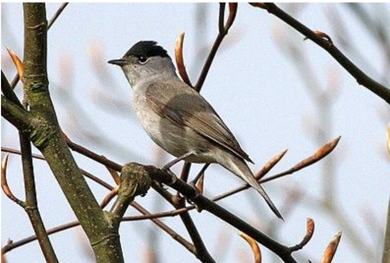
Zwartkop mannetje.

Het is de tijd van het jaar dat de vogels uitbundig fluiten: de mannetjes roepen de vrouwtjes en laten weten wat hun territorium is. We hopen diverse soorten mezen, spechten, duiven, roofvogels en natuurlijk roodborst, merel en vink te signaleren. Hoewel de herkenning op basis van geluid centraal staat, is een verrekijker toch handig voor het geval de vogels zich laten zien. Wie weet komen we de ijsvogel tegen, of de zwartkoppen... Het blijft altijd een verrassing wat we gaan horen en zien.