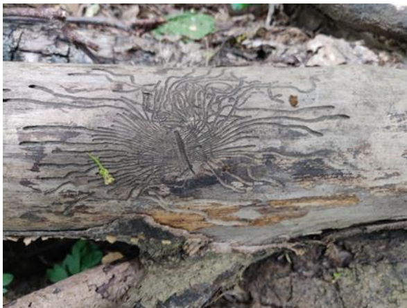
de Letterzetter slaat toe in de naaldbossen

Tijdens deze unieke excursie nodigen we u uit om samen de fascinerende veranderingen in de natuur te verkennen, veroorzaakt door menselijk handelen, dieren en het weer. We gaan niet alleen kijken, maar ook in gesprek over wat we waarnemen en beleven.