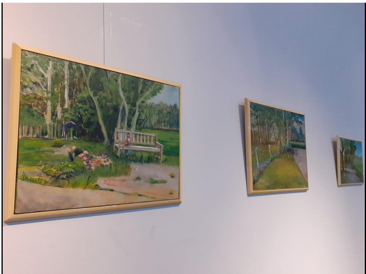
Expositie "De Heerlijkheid Stoutenburg" door de ogen van schilder Franz Hazelzet

Franz Hazelzet, al 13 jaar thuis op de prachtige Heerlijkheid Stoutenburg, laat zich keer op keer verwonderen door de natuur die hem omringt. Zijn schilderijen zijn een eerbetoon aan de eindeloze schoonheid van het landschap, dat met de seizoenen en de wisseling van het licht steeds nieuwe gezichten vertoont. Zijn werk is te zien in het bezoekerscentrum van Heerlijkheid Stoutenburg, waar een selectie van zijn kleurrijke schilderijen tot eind maart 2025 hangt.