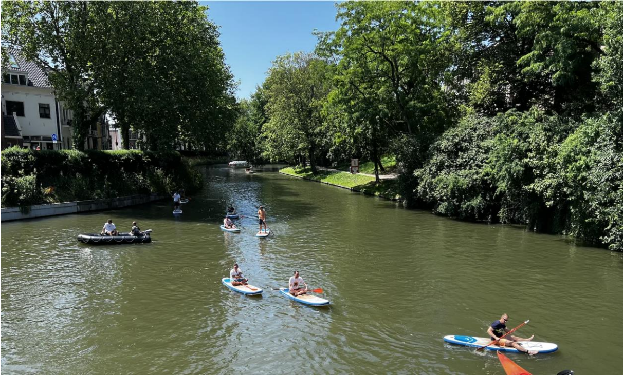
Stadsbuitengracht tussen Ledig Erf en Catharijnesingel, Utrecht