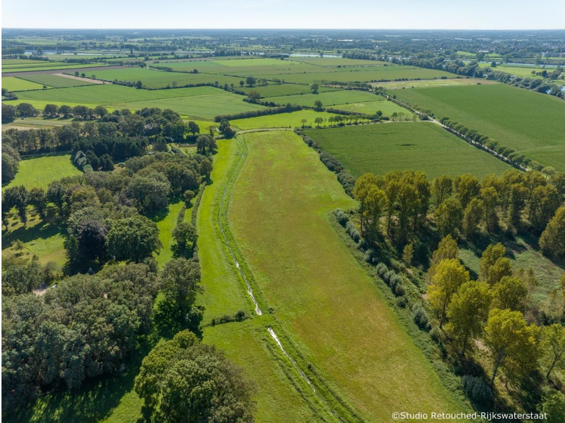
Een deel van het maatregelgebied Geul Ossenkamp en Monding Heijense Leijgraaf, van noord naar zuid gezien, met bovenaan de Maas nog net zichtbaar.

In deze uiterwaard van de Maas waren ooit geïsoleerde kwelgeulen een karakteristiek element. Die werden gevoed door helder en mineraalrijk grondwater (kwel), dat afstroomt vanuit de naastgelegen terrassen en bijzondere waternatuur met zich mee brengt. Daarom wordt ook gekeken of er kansen zijn om kwelgeulen terug te brengen in het landschap. Met name de zuidkant van de Heijense Leijgraaf ter hoogte van Afferden lijkt hiervoor goede mogelijkheden te bieden.