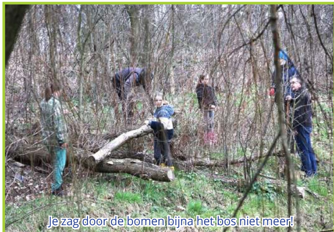
Je zag door de bomen bijna het bos niet meer!