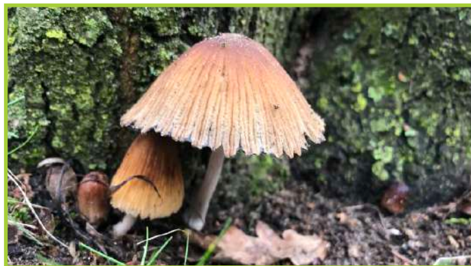
Gewone glimmerinktzwam, Coprinellus micaceus 22 februari 2023 Groesbeek – De Horst – eigen tuin

Het is een uitdaging om op de goede momenten en op de goede plaatsen te zoeken en te proberen aan de hand van je vondsten het hoe en waarom te delen en te bespreken met anderen. Dit is het doel dat ik me stel om samen met anderen een beter beeld te krijgen van de wondere wereld en de betekenis van de paddenstoelen rondom ons heen.