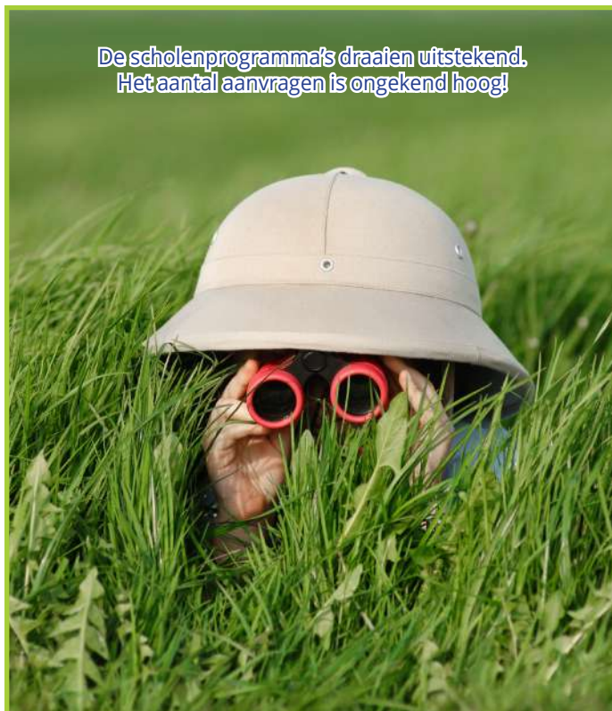
De scholenprogramma's draaien uitstekend. Het aantal aanvragen is ongekend hoog!