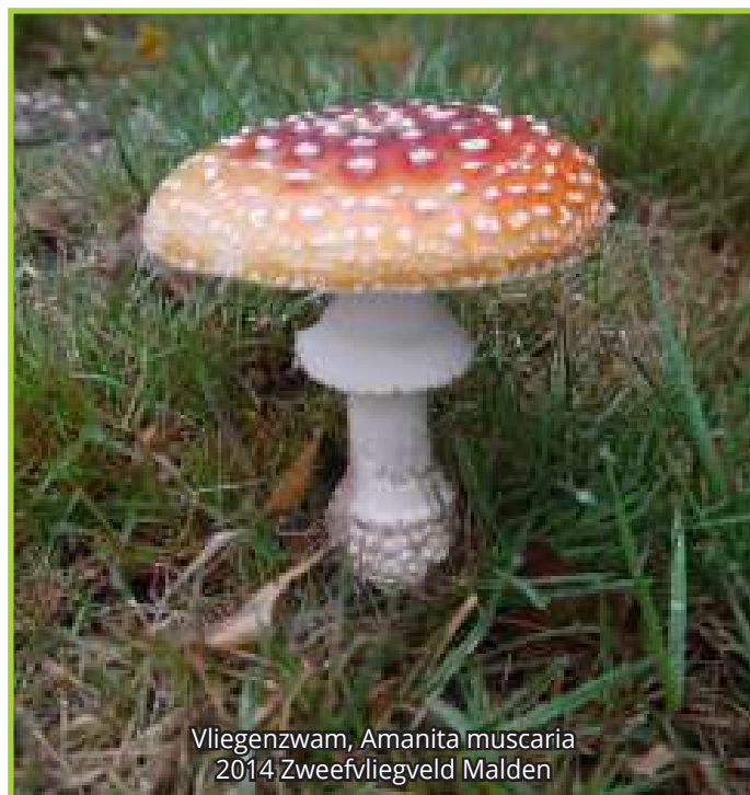
Vliegenzwam, Amanita muscaria 2014 Zweefvliegveld Malden