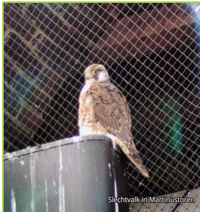
Slechtvalk in Martinustoren