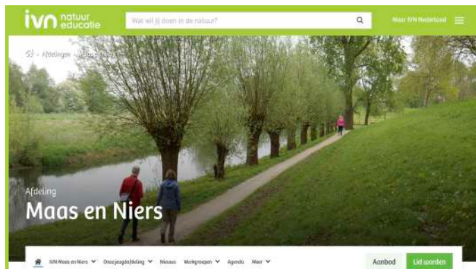
IVN Maas en Niers heeft een nieuwe website.

Ook lokaal roeren we ons. De werkgroepen draaien goed. De activiteiten zijn door een verbeterde publiciteit veel zichtbaarder geworden. De scholenprogramma's draaien dit jaar uitstekend. Het grote aantal aanvragen is onge-