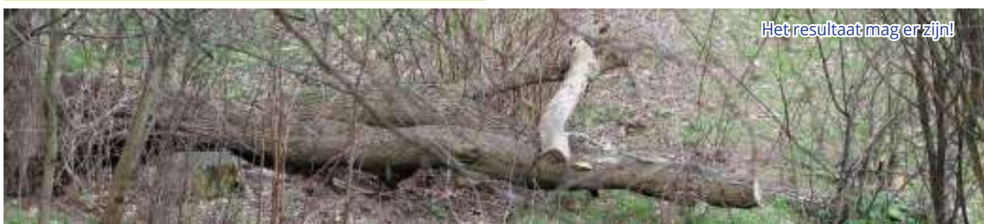
Het resultaat mag er zijn!