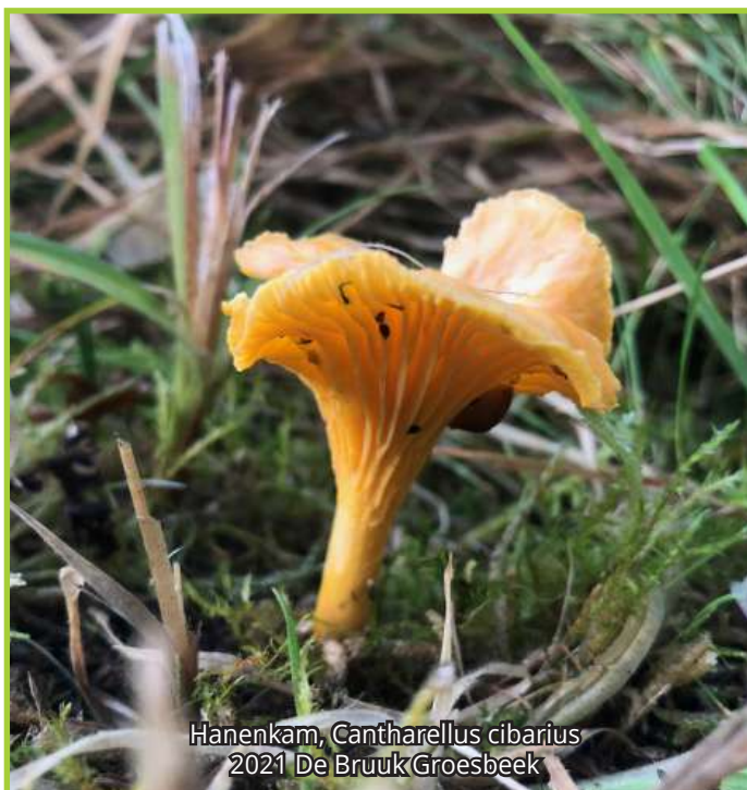
Hanenkam, Cantharellus cibarius 2021 De Bruuk Groesbeek