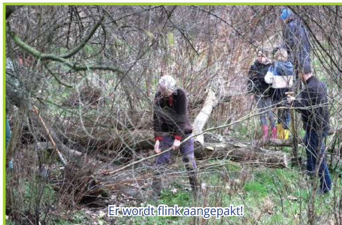
Er wordt flink aangepakt!

Dit gebeurt op zogenaamde oogstdagen, vooral in het vroege voorjaar en over het hele land verspreid, in de grensregio zelfs met buitenlandse inbreng. Een en ander