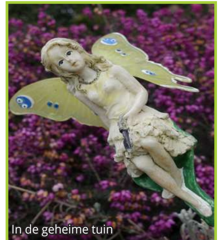
In de geheime tuin