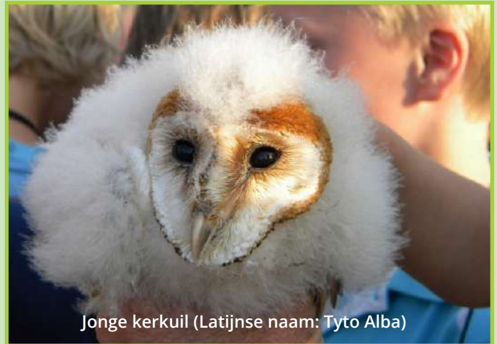
Jonge kerkuil (Latijnse naam: Tyto Alba)

Uilen kunnen hun ogen niet bewegen. Hun ogen zitten vast. Ze kunnen wel hun kop bijna helemaal ronddraaien om alles goed te kunnen zien. Dat kunnen andere vogels niet.