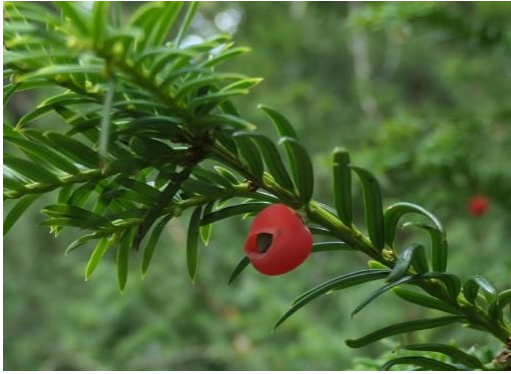
Taxus of venijnboom

Het rode vruchtvlees is eetbaar, het venijn zit in de zwarte pit, die is giftig evenals de rest van de boom.