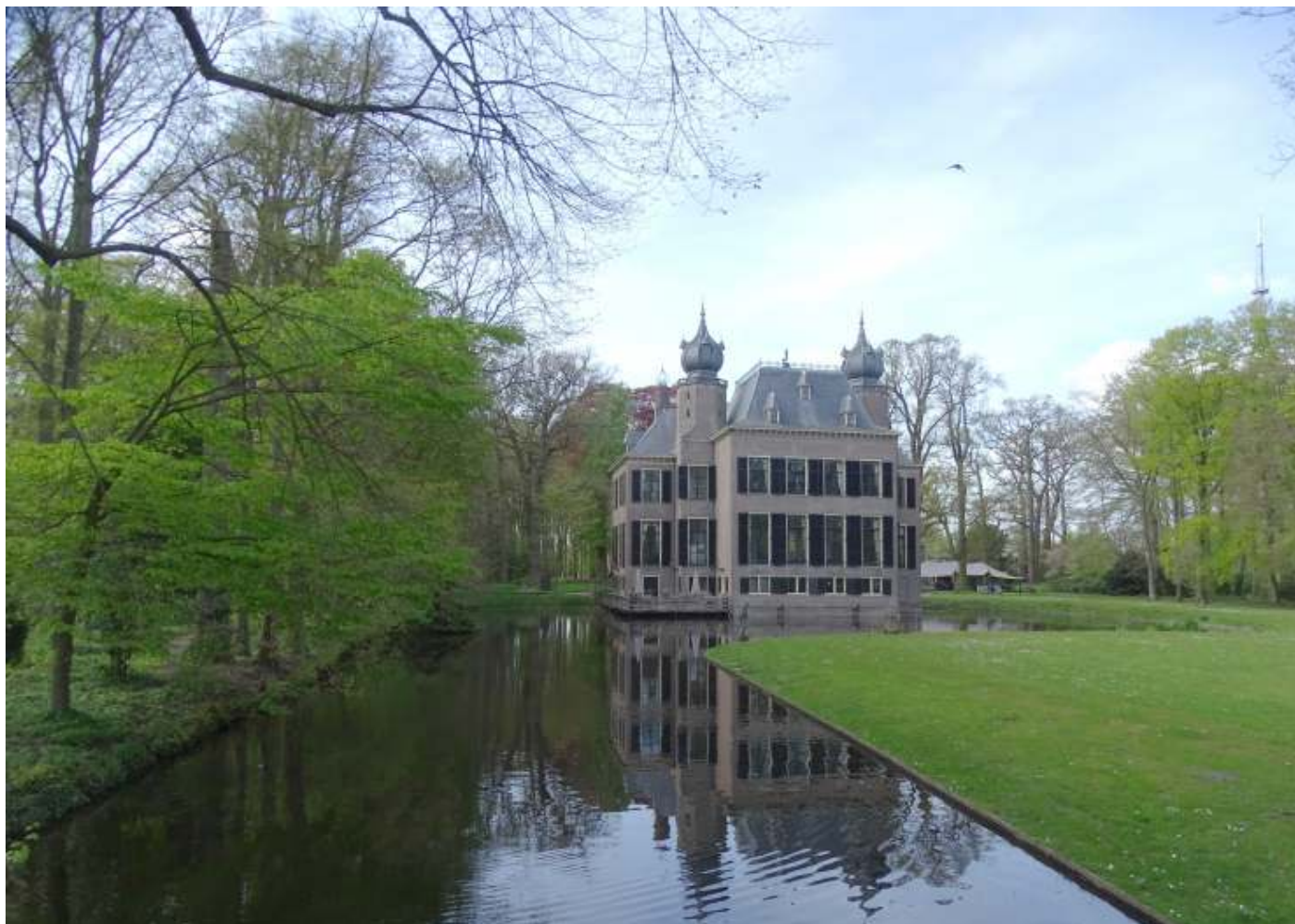
Achterzijde van het kasteel zoals het rond 1640 is opgebouwd (de torens stammen uit de 19e eeuw).

In 2026 hebben wij als KNNV weer vier algemene natuurexcursies gepland, in ieder seizoen één. Dit jaar is de keuze gevallen op het landgoed en de polders van Poelgeest in Oegstgeest.