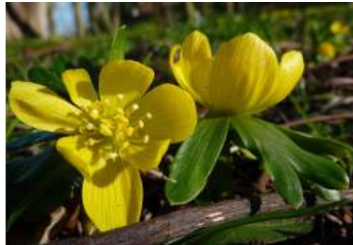
Winterakoniet, Eranthis hyemalis

Ongetwijfeld zien we ook al stinsenplanten als winterakoniet en (mogelijk verschillende?) sneeuwkllokjes.