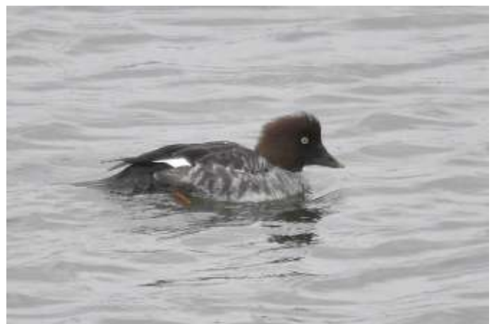
Brilduiker vrouw