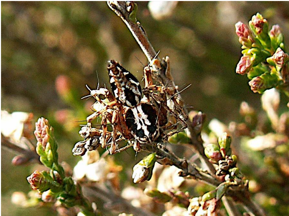
Kijk ook uit naar de volgende Bladgroen