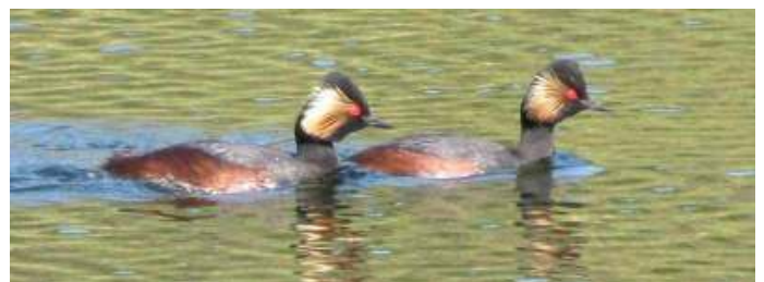
Geoorde futen paar

Aanmelden uiterlijk do. 16 april bij Jaco van Rijn, j67vr@icloud.com , tel. 06-22.35.91.48.