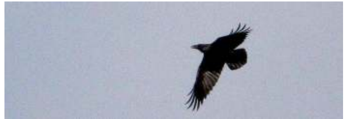
Raaf (wigvormige staart)

Aanmelden uiterlijk do. 19 maart 20 uur bij Arthur Staal, artstaaal@gmail.com , tel. 06-34.34.40.26.