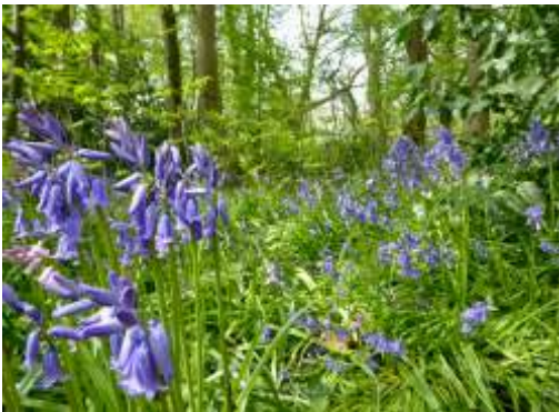
Boshycint, veel voorkomende stinsenplant op Oud Poelgeest

Zie Algemene activiteit aan het begin van 'Programma werkgroepen KNNV'.