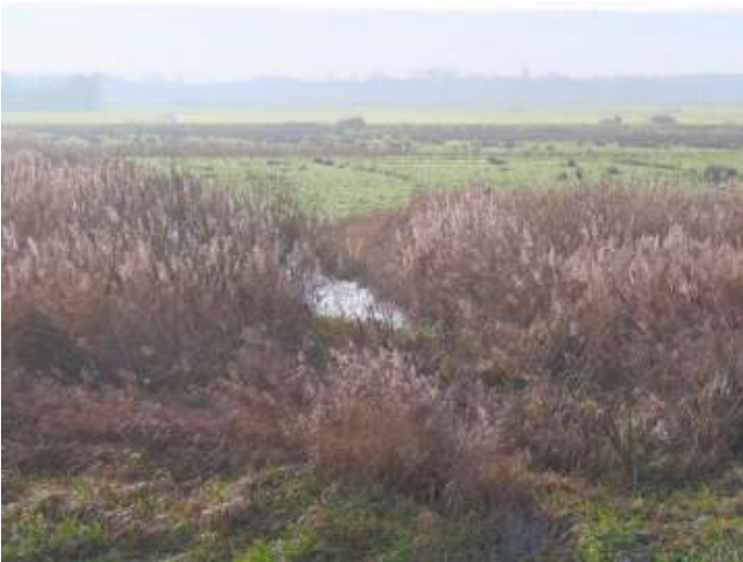
Arkemheen in de ochtendmist