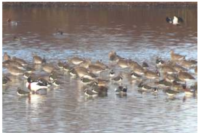
Wulpen en veel meer