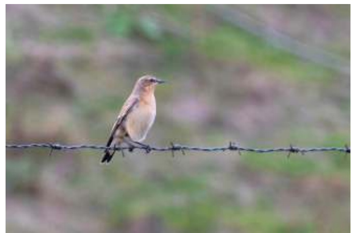
Zwarte roodstaart en Tapuit