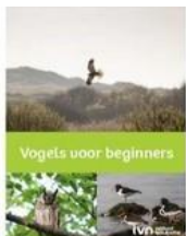
IVN Cursusboek - Vogels voor beginners