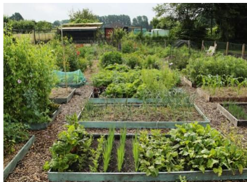
Els Baars op tv bij Droomdorp

Ons oud-lid Els Baars (van de Natuurverhalen en de Natuurverhalenboekjes) is af en toe te zien in de tv serie Droomdorp (5 delen). Dit wordt op maandagen uitgezonden op NPO2 beginnend om ca 22.10 uur.