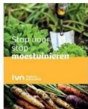
IVN Cursusboek - Moestuinieren