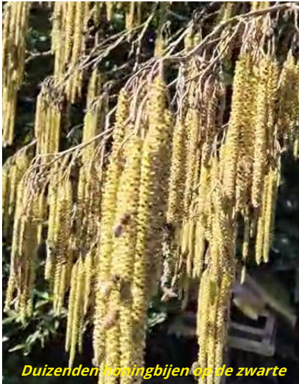
Duizenden honingbijen op de zwarte

Op de vroege voorjaarsdagen van februari vlogen ze weer: de honingbijen van IVN! Wakker uit hun winterslaap en volop vliegactiviteit bij alle kasten. Momenteel hebben we er vijf: drie kasten op de bijenstand bij IVN in Aarle-Rixtel en twee op de Weverkeshof in Nuenen. In dit artikel nemen we jullie, lieve lezers, mee op reis met de bijen door 2026.