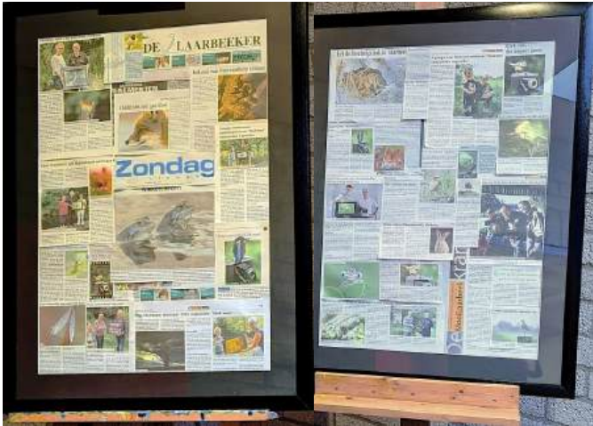
Artikelen in bladen over Kieknou

Afgelopen januari vierde Natuurfotowerkgroep Kieknou van IVN Laarbeek haar 15-jarig jubileum met een groots opgezette expositie in MFC De Dreef te Aarle-Rixtel. Het werd een weekend om met trots op terug te kijken. Voor deze bijzondere jubileumexpositie heeft Kieknou werkelijk alles op alles gezet om er iets moois van te maken. Leden – en verschillende lieverds om hen heen – staken samen de handen uit de mouwen. Het resultaat mocht er zijn: een indrukwekkende tentoonstelling met prachtige natuurfoto's van leden van heden en verleden. Een schitterende presentatie die 15 jaar passie voor natuur en fotografie weerspiegelt.