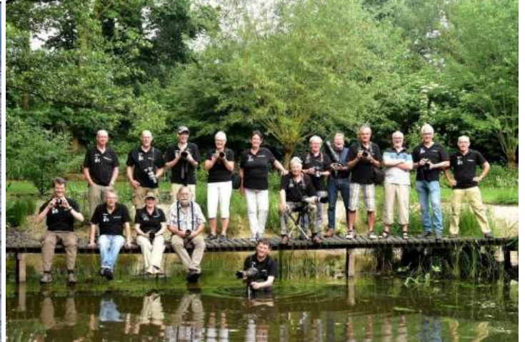
Leden van Kieknou in 2017

Een bijzonder onderdeel van het jubileumweekend waren de presentaties, verzorgd door leden. Met passie vertelden zij over hun werk, hun ontwikkeling en hun liefde voor de natuur. Daarnaast was er een speciale presentatie met natuurbeelden van oud-leden, een prachtig eerbetoon aan de rijke geschiedenis van Kieknou.