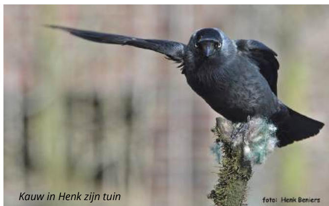
Kauw in Henk zijn tuin