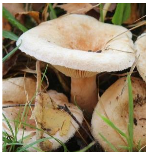
19. Donzige melkzwam