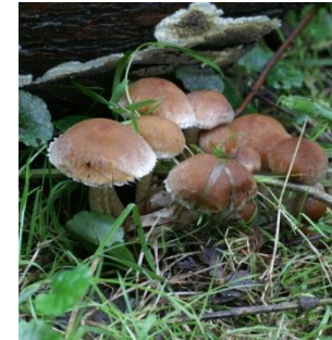
5. Tranende franjehoed