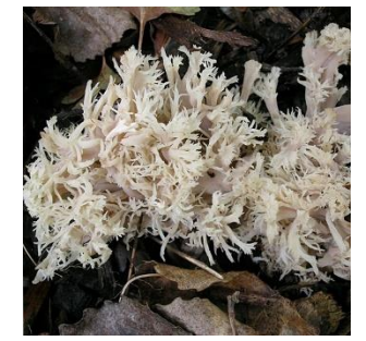
24. Witte koraalzwam