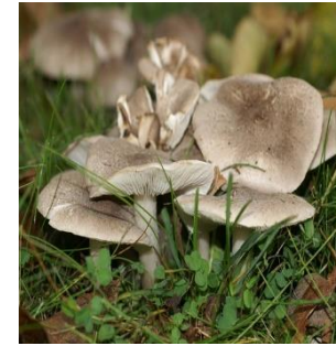
11. Zilveren ridderzwam