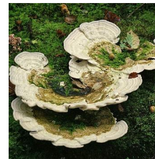
23. Witte bultzwam