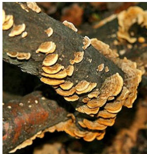
13. Gele korstzwam