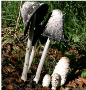
1. Geschubde inktzwam