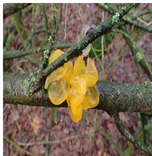
20. Gele trilzwam