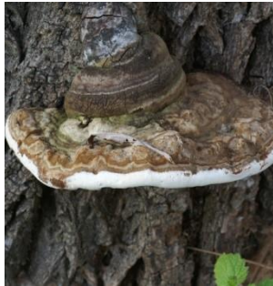
7. Platte tonderzwam