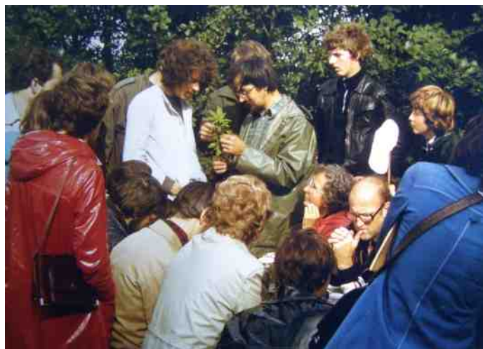
Weekend Oostvoorne juni 1978