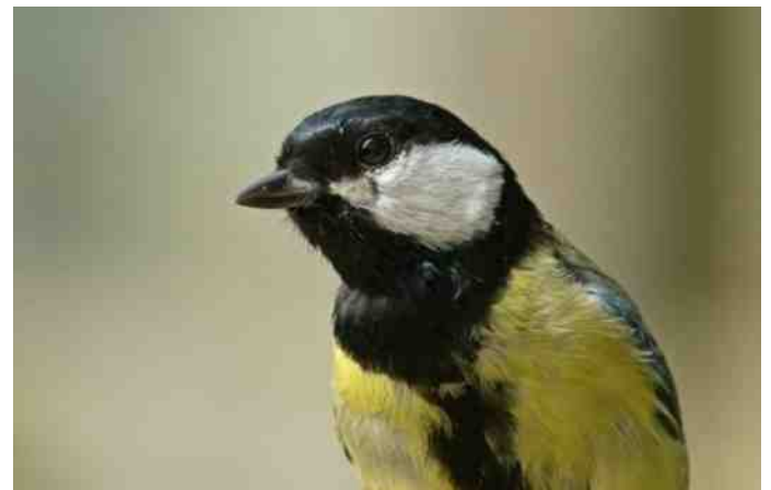
Er zijn nesten in de buurt. Binnenkort op naar de hengelsportzaak voor maden. Als ik mijn haar er in investeer wil ik wel zeker weten dat het een succes wordt.

Vorig jaar lag ik eens onderuit in een tuinstoel. Langzaam, in de namiddag, vielen mijn ogen dicht. Het geluid van mezen en kikkers in de tuin, een biertje. Ik zakte net weg in een plezierige roes toen er aan de haartjes op mijn scheenbeen werd getrokken. Een koolmees had opgemerkt dat hij van die grote zak aardappelen niks te vrezzen had én dat er nestmateriaal op groeide.