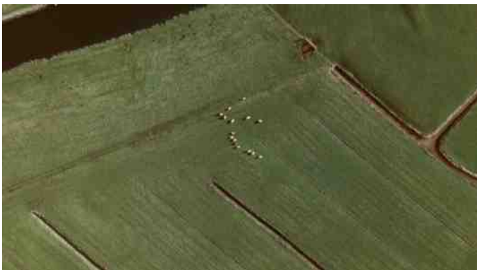
Schape in de Meerpolder. "Lente!" wordt er wel eens geroepen wanneer er lammetjes worden gezien. Maar die zijn er ook al in december. Heeft niks met lente of natuur van doen

Ook voor de insecten maakt het niet veel uit. De meeste insecten overwinteren als ei, en die kunnen uitstekend tegen strenge vorst. Zo is het een mythe dat er na een zachte winter meer wespen of muggen zijn. Althans: dat die overvloed te wijten is aan de zachte winter. Sterker nog: een zachte winter laat ook virussen en schimmels die parasiteren op insecten overleven.