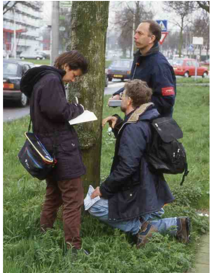
Korstmossen inventarisatie (2000)

Een van de eerste projecten om bewoners van de stad in te schakelen bij het in kaart brengen van de nabije natuur was het "Floron AA-soortenproject" van eind jaren '80 van de vorige eeuw. "AA" staat voor attractieve aandachtsoorten; dat waren plantensoorten die voor de meeste mensen goed herkenbaar en tevens indicatief waren voor het milieu ter plekke. Citizen science avant la lettre! Als stadsecoloog zag ik daar ook toen al de betekenis van in maar het werk wat er aan vast zat werd al gauw veel te veel om er bij te doen.