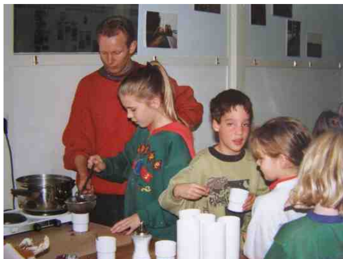
Kinderactiviteit in “De Soete Aarde”, nov. 1992