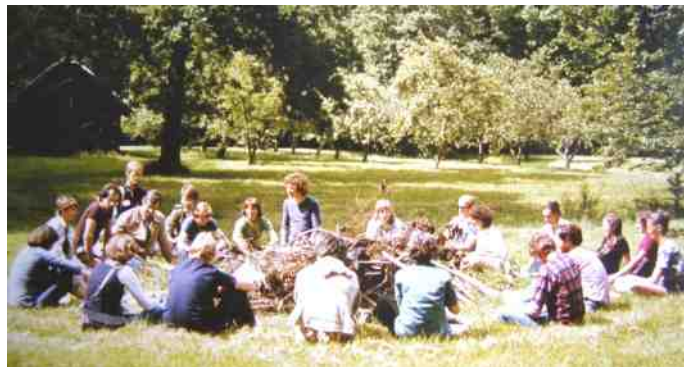
Weekend oostvoorne juni 1978

Na afloop van een wilde plantenproject is begin jaren negentig in Zoetermeer een plantenwerkgroep opgestart en ben ik me meer bezig gaan houden met het inventariseren van wilde planten, wat ik nu nog steeds doe. Ik ben wel 40 jaar lid, maar ik ben niet erg actief geweest voor IVN!