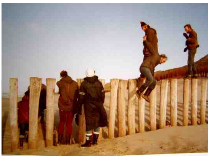
Weekend Zeeland, jan. 1986