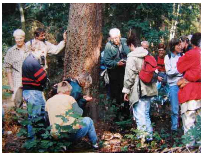
Weekend Bennekom, sept. 1995