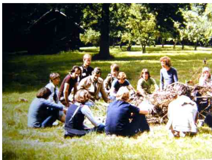
Weekend oostvoorne juni 1978 deel vd groep