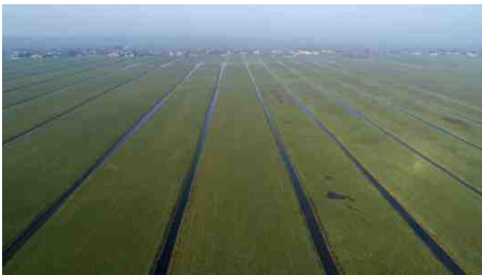
Bij Gelderswoude. Het licht word in februari ook helderder.

De natuur reageert op licht. En daarvan komt er per week zo'n beetje een kwartier bij. Die kou, dat maakt niet uit.