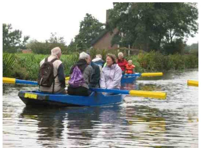
2008: 30 jaar IVN Zoetermeer. Met bootjes vanaf 't Geertje naar boerderij "De Vierhuizen" aan de Geerweg in Zoeterwoude voor een boerenlunch.