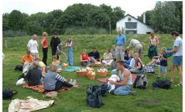
2003: 25 jaar IVN Zoetermeer. Picknick bij 't Geertje