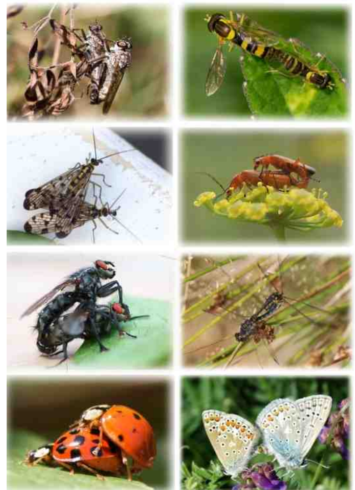
INSECTENPORNO - ROB SCHOUTEN