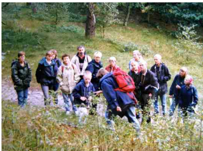
Weekend Bergen aan Zee, sept. 1996

De mees ging er vandoor met een stel haren en ik kan nu zeggen dat mijn DNA deel uitmaakt van een vogelnest.