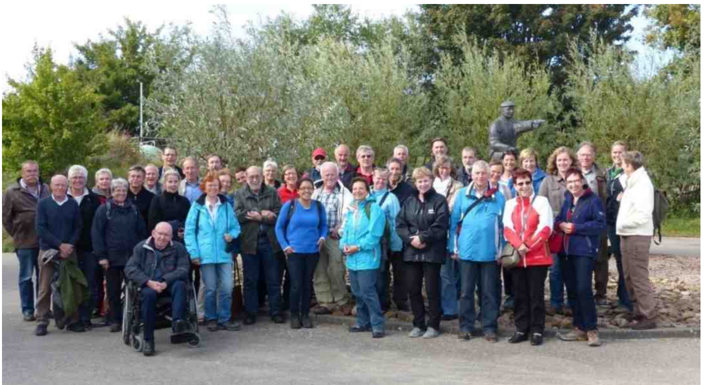
2003: 35 jaar IVN Zoetermeer – Vaartocht door de Biesbosch en een bezoek aan het Biesboschmuseum

Zie voor verdere informatie de website van onze vereniging: www.ivnzoetermeer.nl