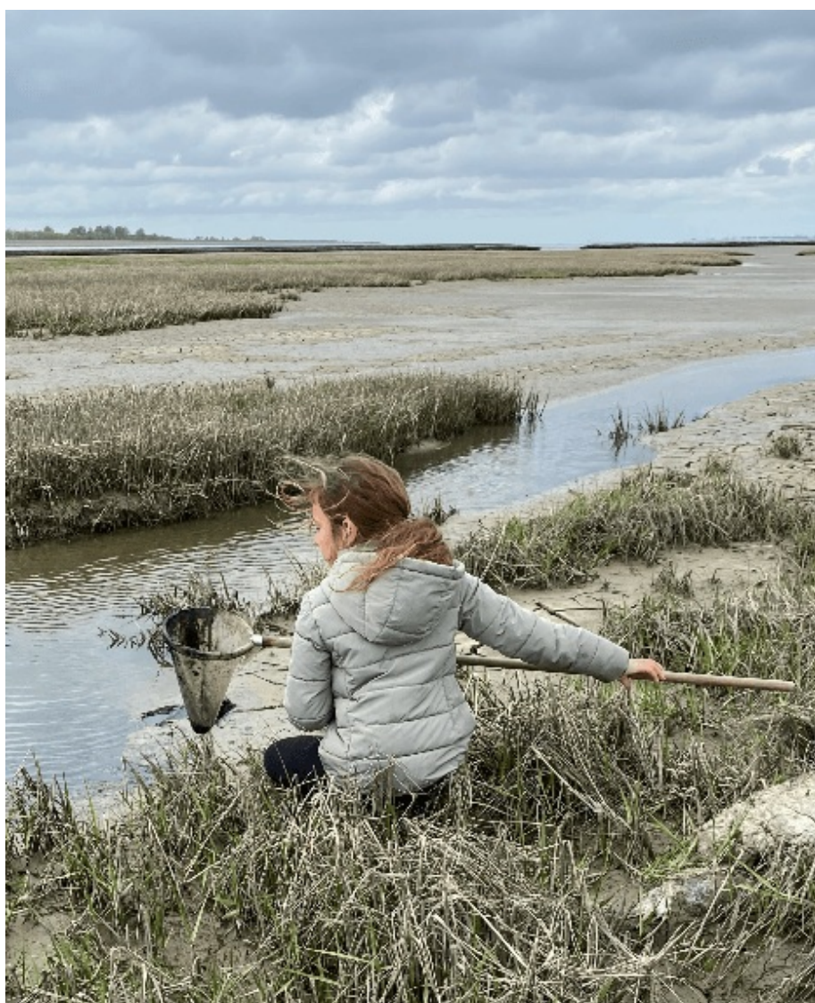
Jonge deelnemer aan wad-activiteit d.d. 10-5- 2026

De meest actuele informatie over onze activiteiten kunt u altijd uitgebreid terugvinden op onze website. Zie hiervoor: Activiteiten IVN Westerkwartier e.o. en Nieuws