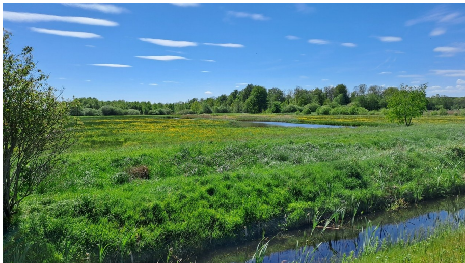
Uitbundig bloeiende weilanden achter Nienoord