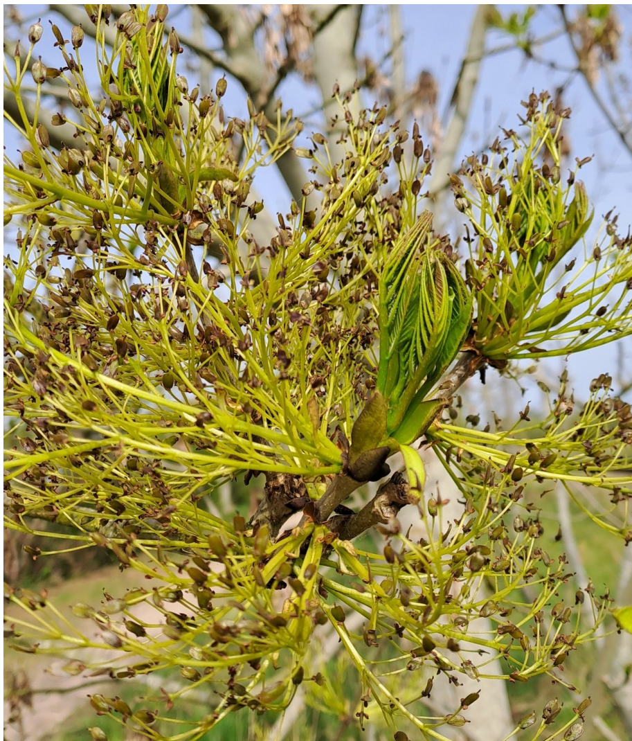
Bloei van de Es