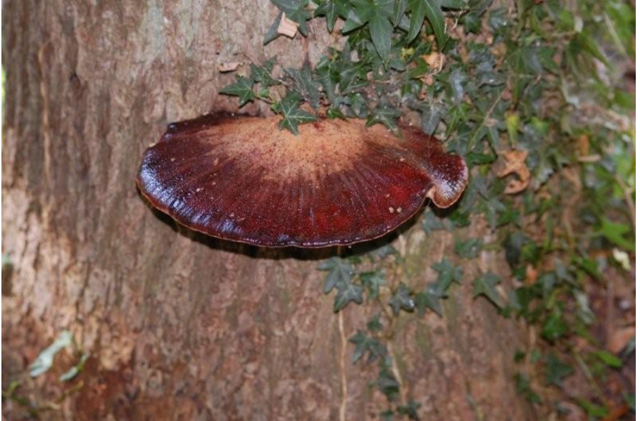
De Biefstukzwam ( Fistulina hepatica )

De tonderzwam omlijstte het geheel met een rokerige zweem, een publiekstrekertje, want wat ruiken we toch? De uitleg was voor veel kinderen nieuw, en velen gingen het bos in met onze vragenlijst om de biefstukzwam te zoeken (ja, hij groeide er echt!). Dat slakken paddenstoelen eten wisten veel kinderen niet.