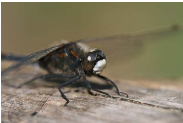
Noordse witsnuitlibel

Terwijl het beter gaat met de waterkwaliteit van beken en rivieren, lopen positieve ontwikkelingen in voedselarme, stilstaande wateren nog achter. De verzurende depositie is de laatste vijftien jaar aanzienlijk gedaald, maar vermessing en verdroging blijven enorme knelpunten voor de ecologische kwaliteit van vennen en hoogvenen. Het is dan ook niet verwonderlijk dat libellensoorten die sterk aan deze biotopen gebonden zijn nog het meest bedreigd worden. De speerwaterjuffer, hoogveenglanslibel en oostelijke witsnuitlibel (herontdekt in 2005) zijn momenteel nog de grootste 'zorgenkindjes' uit deze categorie.