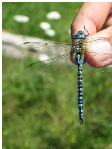
Zuidelijke glazenmaker

Libellen laten zien dat het goed gaat met de natte natuur in Nederland, maar met name de voedselarme systemen blijven achter. Soorten die van deze habitats afhankelijk zijn blijven voorlopig hulp nodig hebben van natuurbeheerders en beleidsmakers. Daarnaast is de verdrogingsproblematiek een belangrijk aandachtspunt voor het herstel van levensgemeenschappen in vennen, hoogvenen en kwelafhankelijke natuurgebieden. Een nieuwe Rode Lijst voor libellen zal korter worden, maar nog niet kort genoeg.