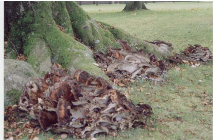
Reuzenzwam op beukenvoet.