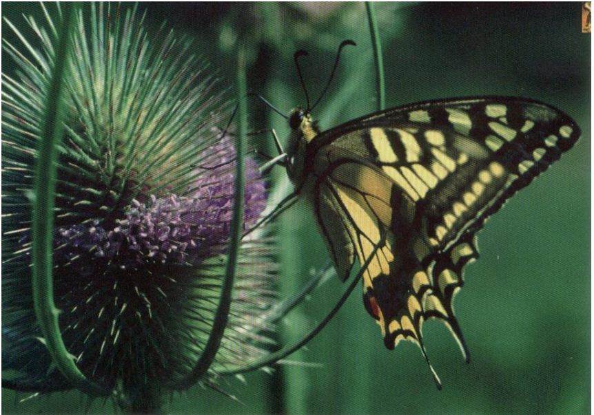
Koninginnepage op Kaardebol

N.B.2: Bij onze activiteiten zijn honden, ook aangelijnd, i.v.m. eventuele verstering van vogels en wild niet welkom.