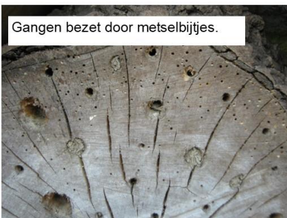
Gangen bezet door metselbijtjes.

IVN Twiske heeft deze muur in 2003 gebouwd. Solitaire bijtjes, hommels en sluipwespen kunnen er hun eitjes in leggen.