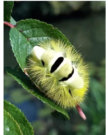
rups vd Meriansborstel

Om onze kennis bij te houden worden er in de winterperiode fotopresentaties gehouden en natuurlijk ook voor de nieuwe leden onder ons is dit zeker een aangename bijeenkomst. Dit wordt vooral in de winterperiode gehouden van januari tot en met maart. In de daaropvolgende maanden tot en met oktober worden er wandelingen gemaakt in omgeving Oss en Bernheze. Wij monitoren niet alleen de vlinders en libellen, maar ook andere insecten komen aan bod. Door al deze gegevens te verzamelen en dit door te geven aan de Vlinderstichting/Waarneming.nl kunnen wij een beeld krijgen over de toestand van de natuur.