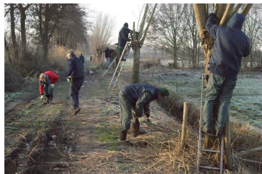
Werkgroep groen en ruimte

Een natuurlijke leefomgeving heeft vele voordelen, zoals het verbeteren van onze gezondheid, ons geluksgevoel, onze creativiteit, sociale vaardigheden en ontspanning. Het is tijd om de afname van de natuur niet langer als vanzelfsprekend te beschouwen, maar om te investeren in het creëren van een natuurlijke leefomgeving waar we allemaal baat bij hebben. Samen met partners werken we aan een groener en gezonder Nederland.