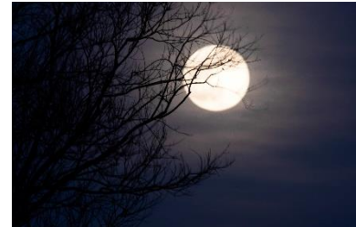
volle maan excursie obv Rene Govers

Een excursie stadsnatuur obv Trinette Stolle van natuur gidsenwerkgroep was gepland maar helaas door het slechte weer moesten we het noodgedwongen 2 keer afzeggen.