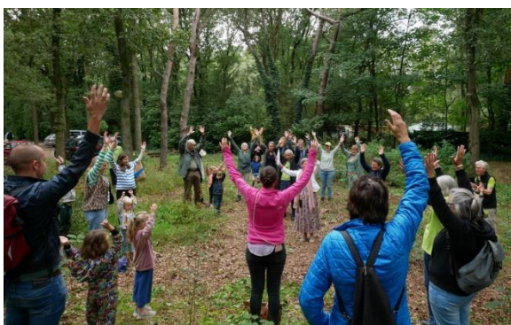
een onderdeel van de slotdag van de cursus JNG

2023 Was getalsmatig wat betreft het aantal gidsen een minder goed jaar. We hoopten d.m.v. enkele acties het ledenbestand wat op te krikken. Aanwas was er mondjesmaat, maar afvallers waren er ook. We hadden eind 2023 slechts 13 actieve gidsen. Voor een gezonde organisatie met ons inzet pakket is het streven om 20 actieve jeugdnatuurgidsen te hebben. We dienen in 2024 vol goede moed door te gaan met werving.