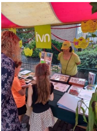
volop belangstelling voor de IVN kraam in Geffen

Het afgelopen jaar 2023 was voor ons als jeugdnatuurguiden inhoudelijk een goed jaar. Niet zonder meer veranderden we de naam van 'scholengids' in 'jeugdnatuurgids': we richtten ons ook op de wat oudere kinderen. Dat betrof nog steeds vooral schoolkinderen, van zowel basis- als voortgezet onderwijs. Die laatste doelgroep is bij ons duidelijk in beeld, maar in uitvoering nog mondjesmaat betrokken.