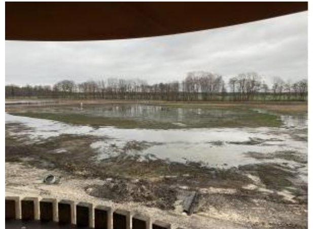
Foto: Uitzicht op de Pastoorsweijer vanuit de toren winter 2023, daarom nog weinig begroeiing.