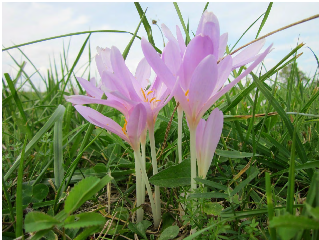
Foto Herfsttijloos