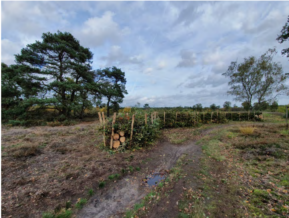
Foto houtwal