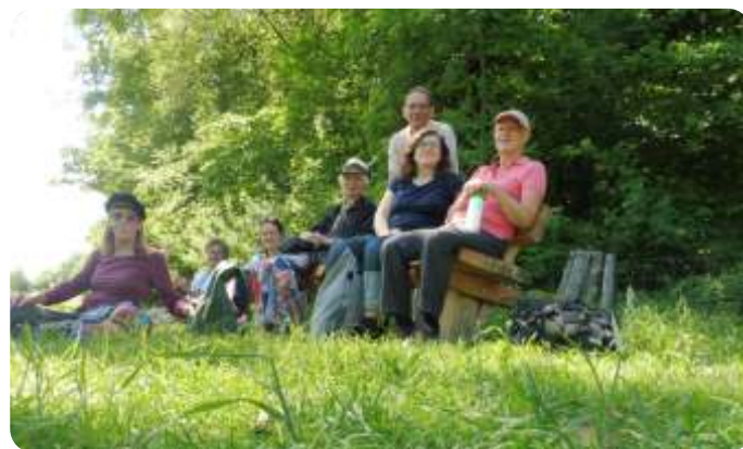
plantenwerkgroep in actie

Ik hoop veel mensen van de plantenwerkgroep te zien, maar ook leden van andere werkgroepen zijn welkom. Je hoeft niet vooraf te melden of je komt, behalve de twee excursies met de auto.