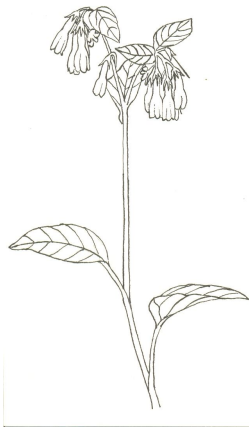
Gecultiveerde smeewortel Symphytum grandiflorum