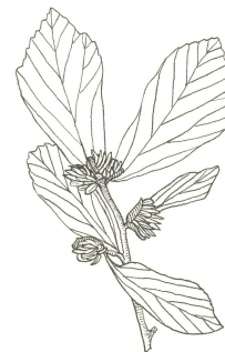
Parrotia persica Perzische parrotia