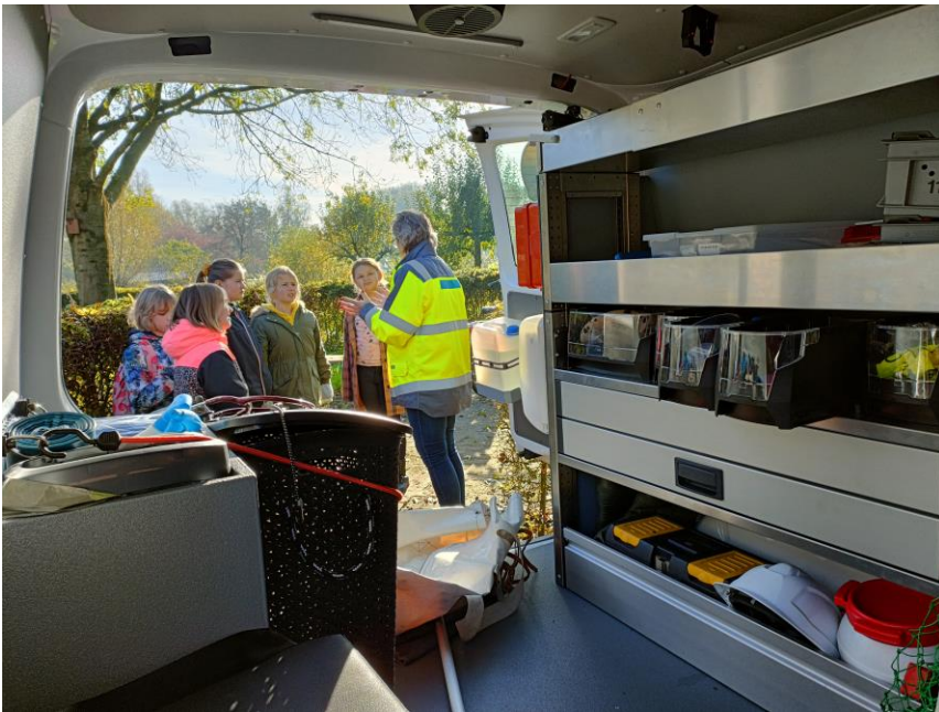
5 - Dierenambulance

we dan precies gaan doen is nog een verrassing. In april steken we onze handen uit de mouwen om de Kinderboerderij te helpen en in mei maken we creaties van takken. In juni ronden we het jaar af met een speciale activiteit en nemen we afscheid van de Fladderaars die naar de middelbare school gaan. Zij kunnen door naar de NatureXplorers. Voor het najaar van 2024 moet het programma nog worden opgesteld, maar zeker is dat we dan ook weer veel zullen ondernemen.