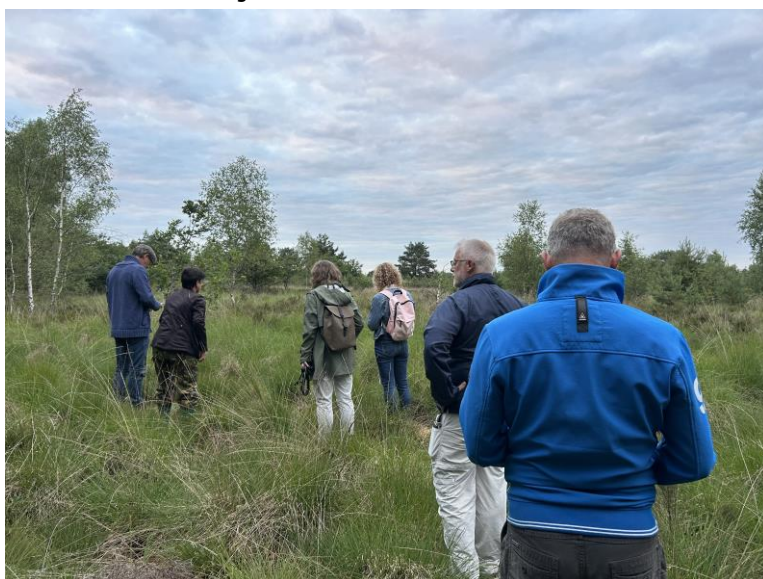
6 - Nachtzwaluw excursie

Het jaarplan 2024 is mede bepaald door de laatste gidsencursus. Er zijn 8 geslaagde gidsen die in 2024 mee gaan lopen met de excursies. Niet meegeteld zijn 2 gidsen die al eerder in excursie meeliepen. Daardoor zijn er in 2024 9 nieuwe excursie opgenomen die nog nooit gelopen zijn. Er is steeds vraag geweest meer nieuwe bestemmingen te programmeren. Dat is nu gelukt. De goedlopende excursies blijven in het programma zoals: wandeling door het historisch poldergebied, de interactieve natuurapotheek, paddenstoelen zoeken, vogels kijken in het Zaanse Rietveld en vleermuizen spotten. We blijven nauw samenwerken met de vrienden van het Heempad. Het aanbod is gericht op meerdere doelgroepen zoals, doe-excursies en excursies met veel informatie zoals de polderwandelingen en Kromme Aar.