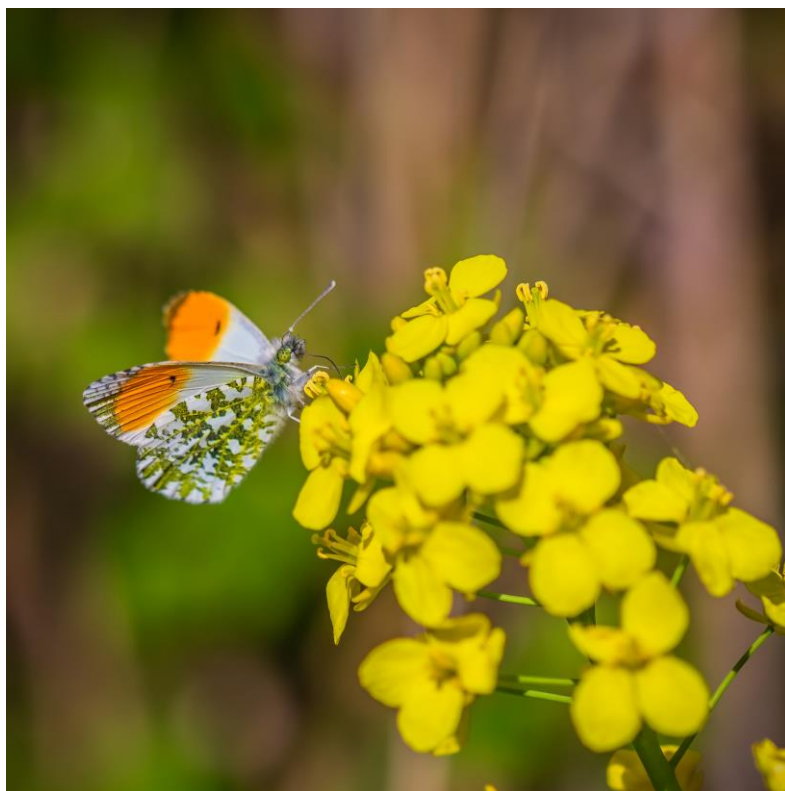
8 - Oranjetipje

De werkgroep werkt met een overzicht van alle gebiedjes en weet o.a. door ervaring wat er nodig is per gebiedje om de natuurwaarde in stand te houden en soms te verbeteren. De werkdagen zijn vaak gezellige dagen, mensen beschouwen het als een nuttige en aangename bezigheid met oog voor elkaars bekwaamheid ongeacht achtergrond of deskundigheid. Leeftijd speelt geen rol en gelukkig is er tot nu toe voldoende instroom. De gemiddelde leeftijd loopt wat op maar ja dat krijg je met een toenemende vergrijzing in Nederland, oplopende pensioenleeftijden en de huidige generatie werkenden, die vaak volle dagbestedingen hebben. Nieuwe vrijwilligers blijven meer dan welkom en