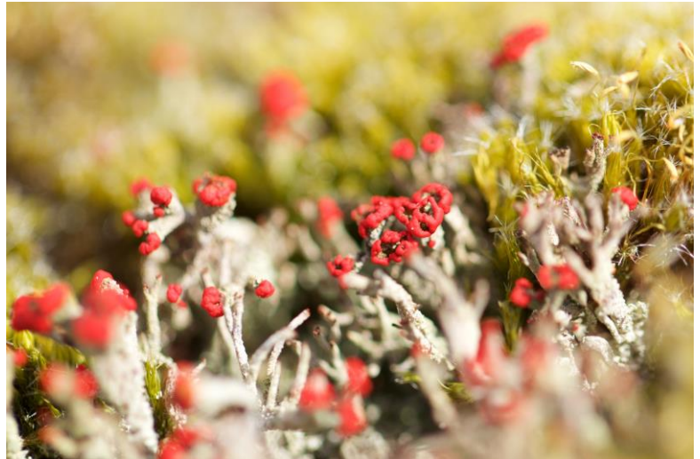
3 - Heidelucifer

Een ander nieuw initiatief is de 'Plantenwerkgroep in oprichting'. De groep bestaat uit 11 enthousiaste mensen afkomstig voor een groot deel uit de NGO-groep, die in juni 2023 zijn geslaagd voor de Natuurgidsenopleiding. De doelen van de werkgroep en te behalen resultaten zijn nog onderwerp van gesprek. Gedacht wordt aan kennis van planten te vergroten/te verdiepen door te kijken, te onderzoeken en verhalen daarover te delen met elkaar. Verder wil de plantenwerkgroep mee doen aan de Eindejaars-plantenjacht van Floron en in juni 2024 participeren in een Citizen Science onderzoek om de kwaliteit van de oevervegetatie in kaart te brengen.