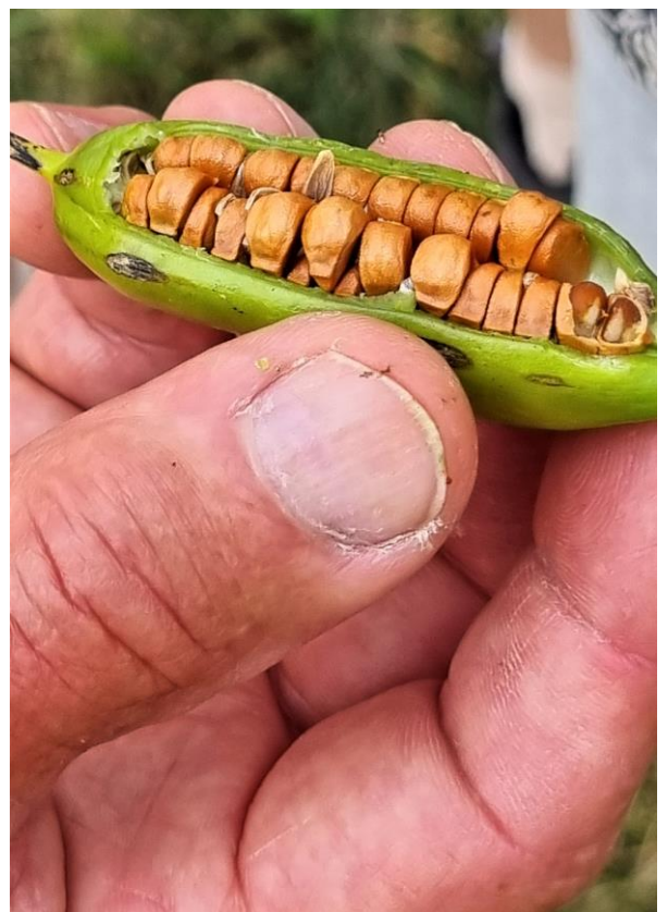
7 - Excursie zaden

De Vogelwerkgroep zal dit jaar ook weer volop aantrekkelijke excursies organiseren. Een aantal publieksexcursies binnen ons werkgebied om inwoners meer bekend te maken met hier voorkomende vogelsoorten. Daarnaast organiseert de vogelwerkgroep weer maandelijks een excursie naar een aantrekkelijk vogelgebied om met elkaar vogels te ontdekken. Deze excursies zijn voor de wat meer gevorderde vogelaars.