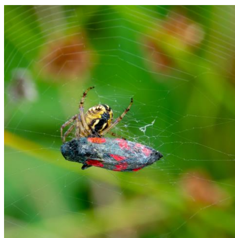
1 - Heidewielwebspin met Sint-Jansvlinder