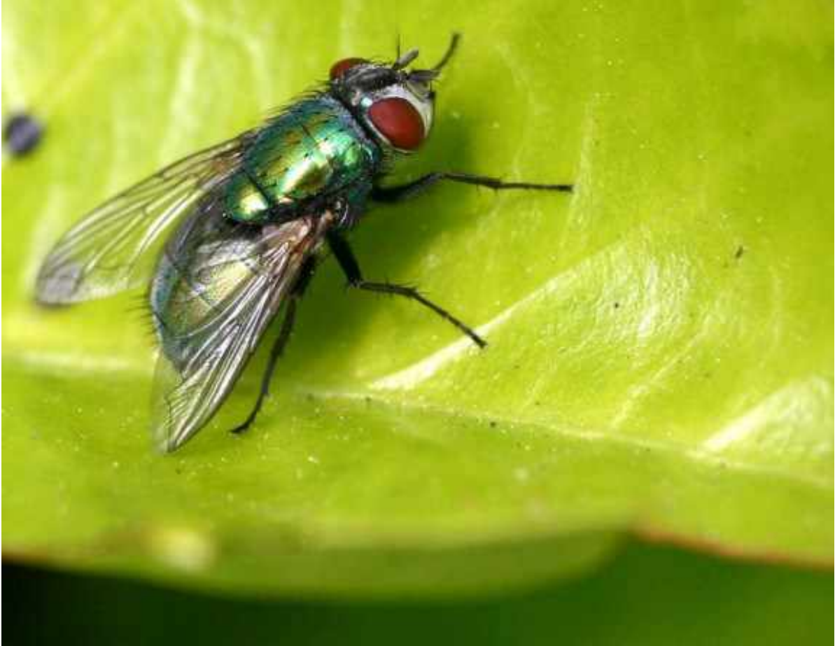
groene vleesvlieg