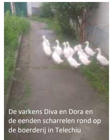
De varkens Diva en Dora en de eenden scharrelen rond op de boerderij in Telechiu