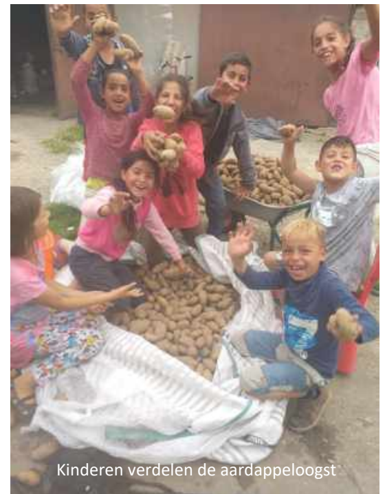
Kinderen verdelen de aardappeloogst