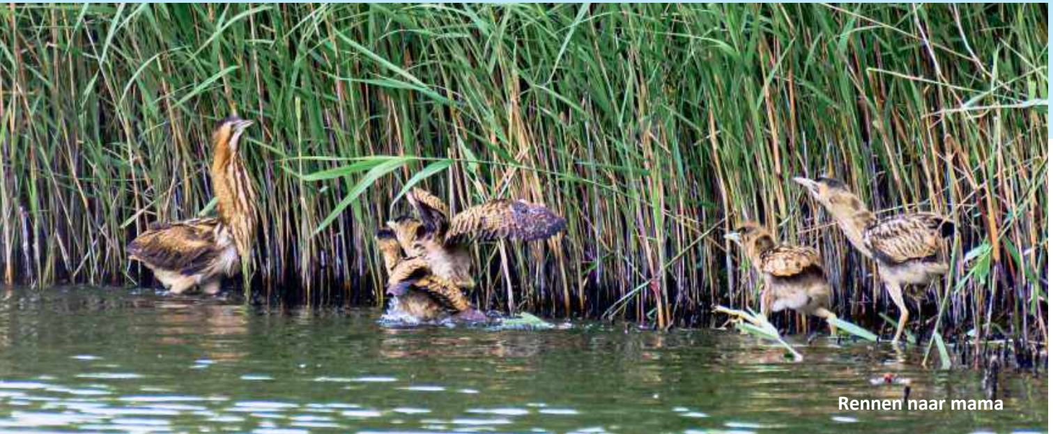
Rennen naar mama