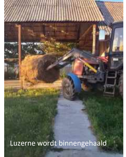
Luzerne wordt binnengehaald

Dit voorjaar zouden er stagiaires van de Landbouw Hogeschool Van Hall Larenstein Arnhem komen, om ons in Roemenië verder te helpen met het realiseren van het voedselbos. Door de coronapandemie is alle bezoek aan Telechiu vanuit Nederland echter gecancelled. Er kwam een volledige lockdown, waardoor de Romabevolking in Telechiu als dagloners, zonder werk en zonder inkomsten kwamen te zitten. Dus ook zonder eten!