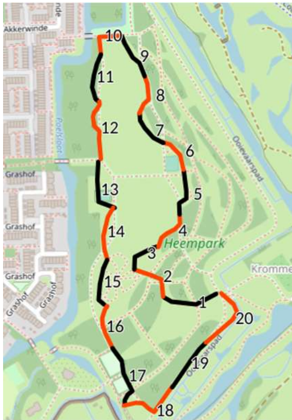
5 - Dagvlinderroute Irenebos