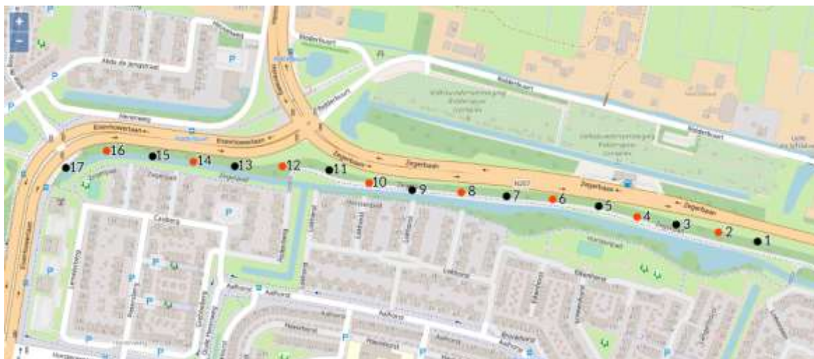
7 - Dagvlinderroute Geluidswalpad