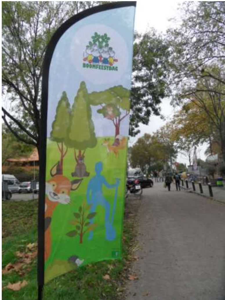
18 - Boomfeestdag