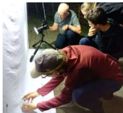
6 - Nachtvlinderen

In 2021 is het nachtvlinderen bij het Bezoekerscentrum De Veeweiden opgepakt. Het doel was elke maand te vlinderen maar door corona is dit niet alle maanden mogelijk geweest. We hebben in totaal 7 nachten soorten geteld. In bijlage de is dit uitgewerkt. De Nationale Nachtvlindernacht was 3 en 4 september. Wij hebben gekozen om deze alleen op 3 september te houden. We hebben hier niet al te veel bekendheid aan gegeven omdat we nog steeds met corona te maken hadden. Ondanks dat waren er toch tussen de 20 en 25 bezoekers.