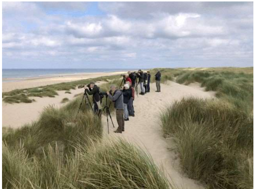
7 - Excursie Vogelwerkgroep

Vanwege de beperkingen vanwege de coronapandemie hebben er in 2021 slechts twee vogelexcursies plaatsgevonden. Eén naar Noord-Holland en één naar de Maasvlakte/Westplaat (ZH). De belangstelling was groot. Ter compensatie van het uitblijven van excursies en om werkgroepsleden te activeren er zelf op uit te gaan, zijn bijna in ieder kwartaal Nieuwsbrieven uitgebracht met het laatste vogelnieuws uit de regio. In juni 2021 is er een vlinderexcursie geweest naar het Bentwoud bij de zogenaamde Zeemanheuvel. Hieraan hebben 5 vrijwilligers van de Vlinderwerkgroep deelgenomen.