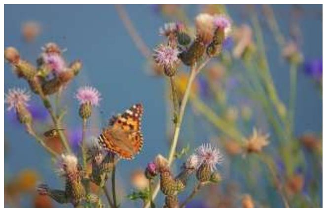
16 - Distelvlinder