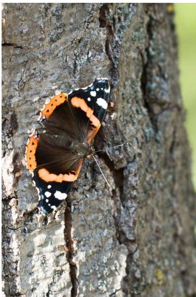
17 - Atlanta