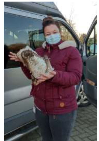
11 - Berkenstammetjes voor Oudshoorn