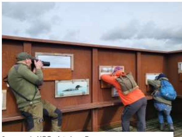
8 - excursie NGO - foto Irma Brugmans

In 2021 is energie gestoken in het opnieuw opstarten van de Natuurgidsenopleiding voor 2022-2023. Hierbij is vooral aandacht geschonken aan een coronaproof opzet. Het aantal persoonlijke contacten is minder. Een aantal theorielessen kan ook via Zoom worden gegeven. De groep wordt voor de excursies in tweeën gesplitst en worden geconcentreerd op één zaterdag. Zo kunnen de ochtend- en middaggroepen met elkaar wisselen en is de groepsgrootte beperkt.