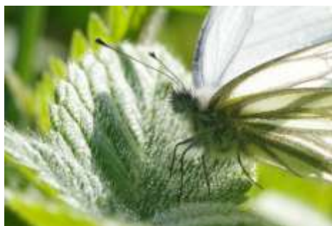
14 - Klein geaderd witje