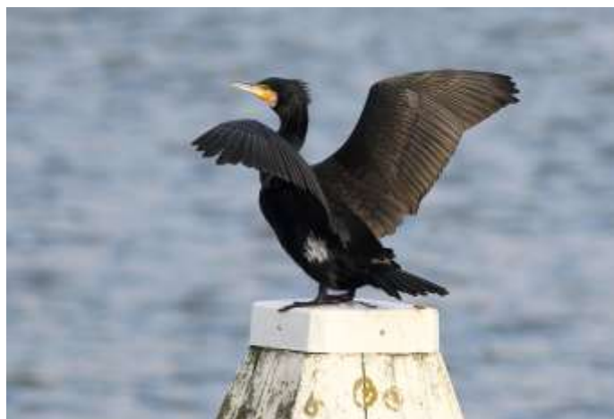
5 - Aalscholver - foto Rene van Rossum