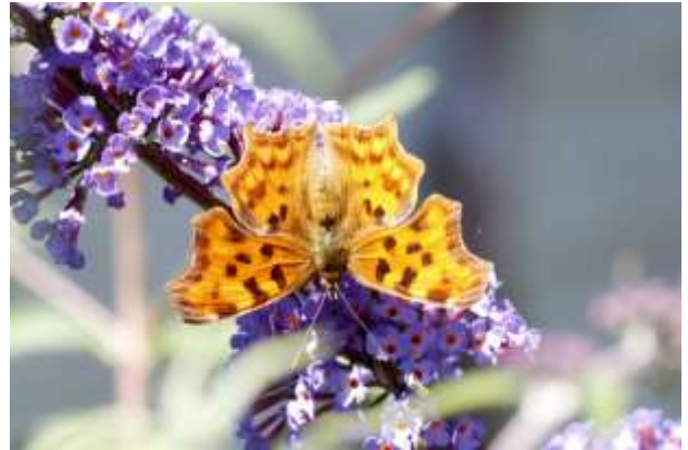
15 - Gehakkelde Aurelia