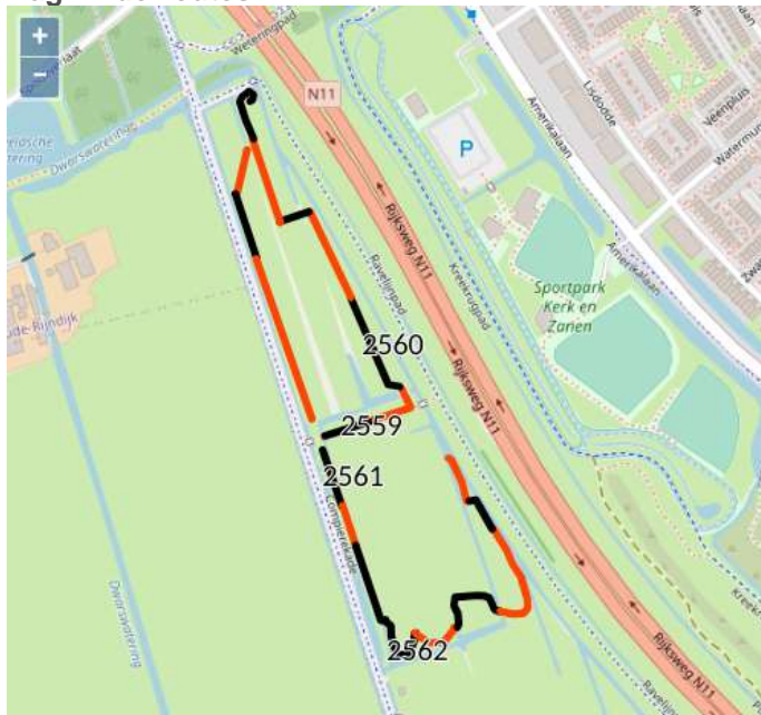
3 - Dagvlinderroutes Compierekade