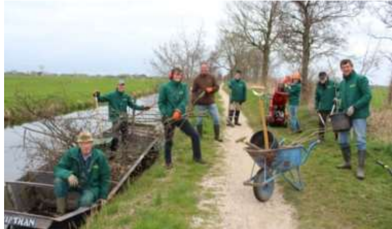
3 - VLB

Dit jaar hebben we ondanks het tweede jaar met Coronabeperkingen toch veel gedaan. We zijn 36 keer op pad geweest met gemiddeld 6 vrijwilligers. Uitschieters waren de Natuurwerkdag in november met 28 vrijwilligers en een keer planten met 3 vrijwilligers. We zijn op 16 locaties bezig geweest en hebben daar 860 werkuren ingestoken. De meeste locaties zijn helemaal bij, enkele locaties hebben een lichte achterstand. Over het geheel gezien zijn we deze twee Corona jaren goed doorgekomen en hebben we aan onze verplichtingen kunnen voldoen.