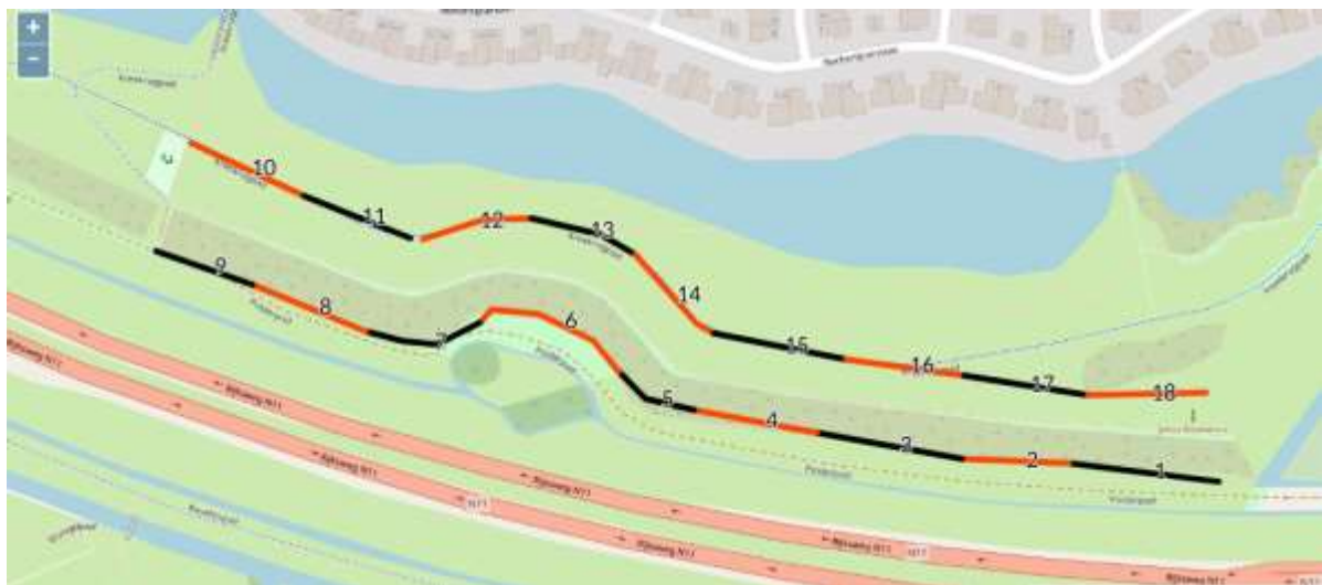
4 - Dagvlinderroute Limes Alphen aan den Rijn