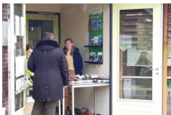
10 - Stekjesactie