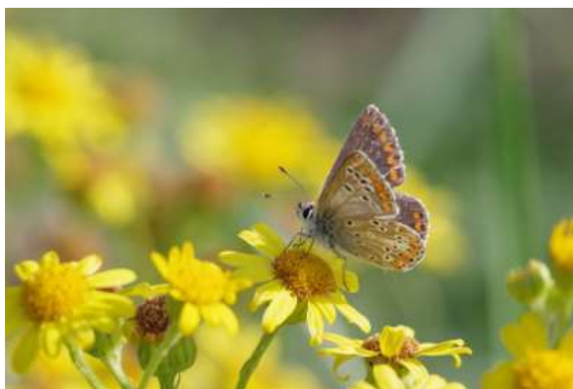
1 - Bruin Blauwtje