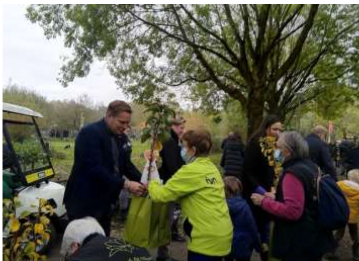
9 - Uitreiken boompjes aan genodigden

Alle genodigden kwamen daarbij langs het Bezoekerscentrum De Veenweiden. Bij het BC worden 200 tasjes gevuld en uitgereikt met Groei & Bloei en IVN-informatie. En 350 zakjes oranje Prinses Irene bloembollen worden uitgereikt namens de gemeente Alphen aan den Rijn. Dankzij de inzet van behulpzame IVN-vrijwilligers kwam dit snel en goed voor elkaar.