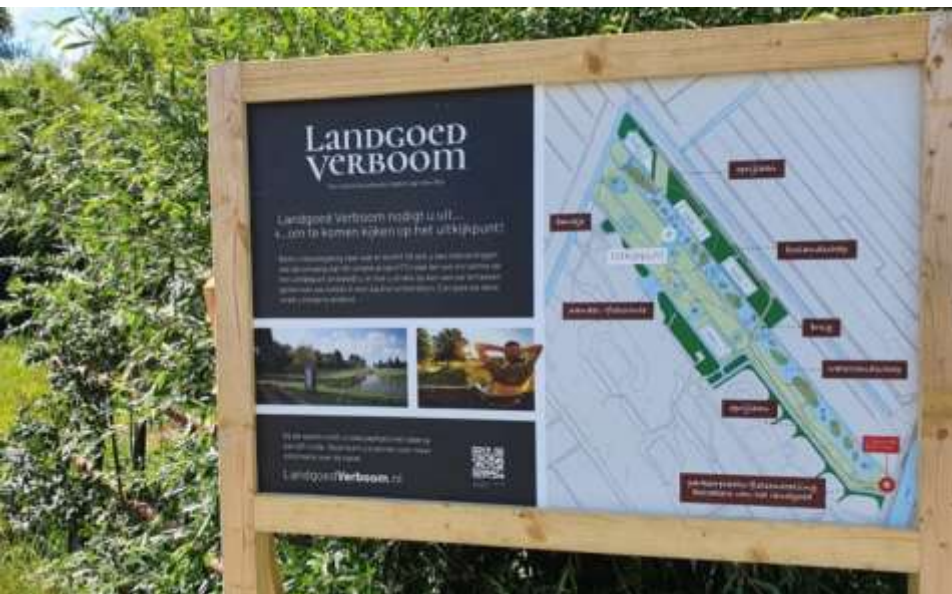
2 - Landgoed Verboom

IVN Alphen aan den Rijn volgt de majeure planologische en beheerontwikkelingen in de Gemeente Alphen aan den Rijn. Waar nodig wordt geprobeerd het beleid/beheer bijgesteld te krijgen. Onderwerpen die het afgelopen jaar de aandacht hebben gevraagd: