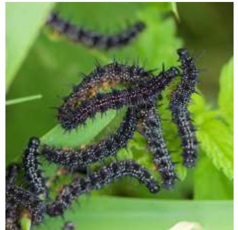
13 - Dagpauwoogrupe