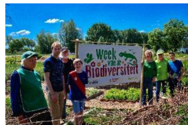
Activiteiten opening biodiversiteitsweek

Gedurende de hele week werden er diverse Bioblitz-activiteiten gedaan waarbij de biodiversiteit op diverse plaatsen in de stad werd onderzocht. Op woensdag was er een rondleiding door de Heemtuin met aansluitend een vleermuizenexcursie. Donderdag kon je braakballen pluizen op het Heempad en in het tweede weekeinde kon men aan de slag met het onderzoeken van de natuur op en rond het Heempad.