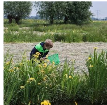
Slootjesdag in de Week van de Biodiversiteit