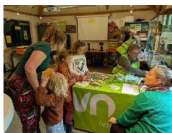
Natuuractiviteiten en natuurpad Heempad