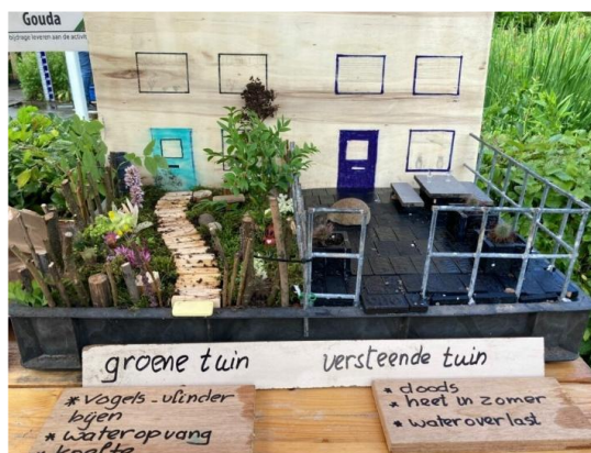
Kraam tuinambassadeurs Groene festival

Op 24 en 25 mei stonden we wederom met een kraam en biologische kruidenplanten om uit te delen twee dagen op de kinderboerderij tijdens de Hofstedendagen.