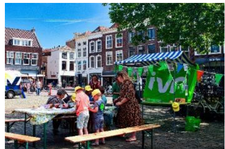
IVN op het Super Cool Kidsfeest

Ook IVN IJssel en Gouwe stond hier weer met een natuuractiviteit die goed bezocht werd. Ongeveer 80-100 kinderen hebben bodemdierpjes bewonderd.