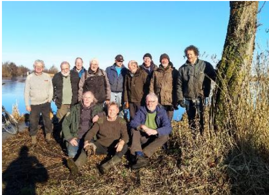
Wilgen knotten aan de Hortemansdijk

In het najaar is het VLB namens IVN IJssel en Gouwe betrokken geraakt bij het initiatief van bewoners, de stichting 12 Reeuwijkse Plassen en de gemeente Bodegraven-Reeuwijk om snoei- of slootafval niet af te voeren maar her te gebruiken voor natuurherstel in het gebied. Hiervoor is een plan gemaakt om als eerste experiment in januari 2026 de wiepen van knotwilgen aan de Hortemansdijk niet te versnipperen en af te voeren door de gemeente Bodegraven-Reeuwijk maar door vrijwilligers (bewoners en VLB/IVN) te verwerken tot palen en takkenbossen ten bate van oeverherstel van een aantal eilanden in de plas Ravensberg.