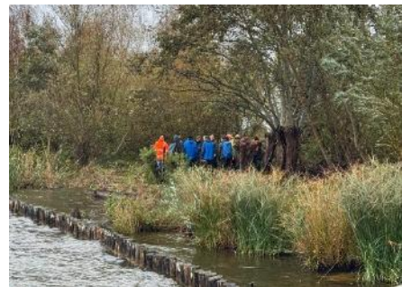
Nationale natuurwerkdag

We concluderen dat het VLB in dit beschreven seizoen heeft kunnen voldoen aan haar onderhoudsverplichtingen en dat er ruimte was voor een structurele uitbreiding van het aantal terreinen.