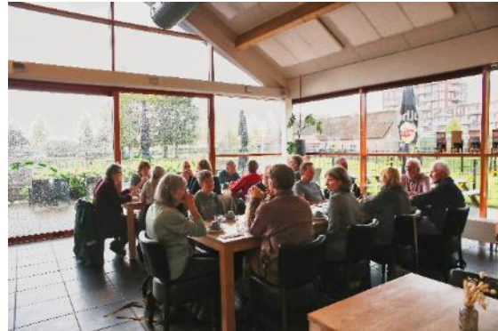
Ledenuitje Nieuwe Driemanspolder