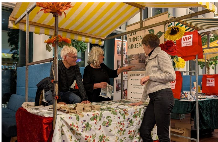
Kraam Huis van de stad

En ook waren we wederom aanwezig met een kraam bij de nieuwe bewonersavond op 17 november in het Huis van de Stad.