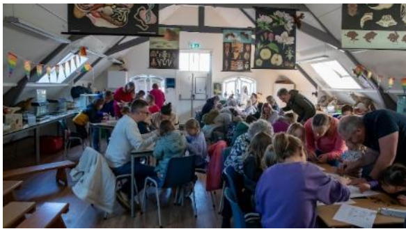
Uilenballen uitpluizen