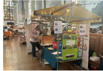
Kraam op Duurzaamheidsmarkt

Samen met KNNV Gouda e.o. organiseren wij ook de Natuuracademie. Met het Platform 'Samen duurzaam Gouda' werken we samen op het gebied van duurzaamheid. In het najaar hebben we met hen deelgenomen aan de Duurzaamheidsmarkt in de Sint Jan.