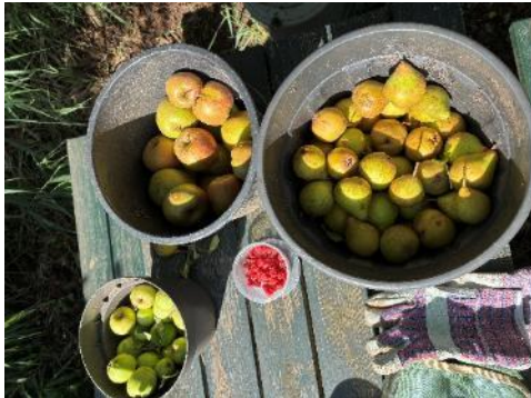
Oogsttijd in het voedselbos

2025 was letterlijk een vruchtbaar jaar . De opbrengst aan bessen was uitzonderlijk groot. Onder andere kweeperen, mispels, tayberries, jostabessen, druiven, zwarte bessen en olijfwilgbessen groeiden ons boven het hoofd.