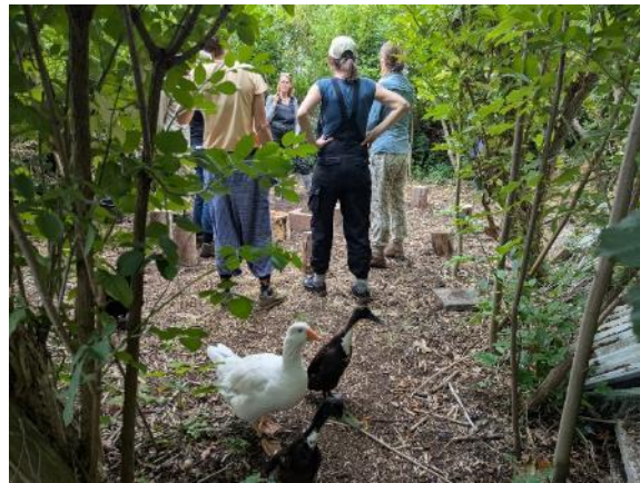
Rondleidingen in het voedselbos

Tijdens de lente was er een natuurspeurtocht uitgezet, die doorlopend door bezoekers kon worden gedaan.