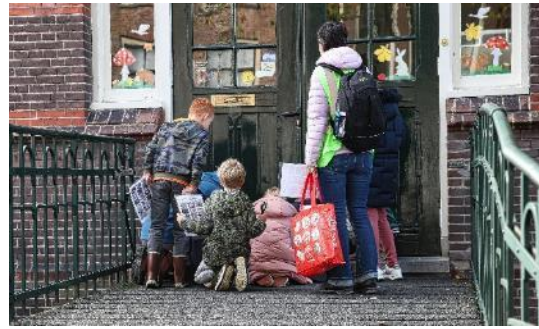
De wilde stad