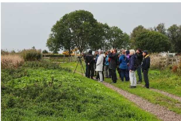
Excursie Hooge Boezem

Nieuw was ook de lezing van Niels de Zwarte over natuur in de stad. De eindejaarsplantenjacht is ook een vaste excursie. Helaas is de interesse niet hoog.