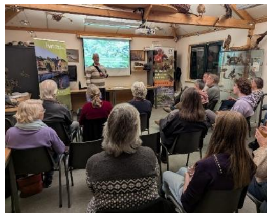
Lezing Natuur in de stad