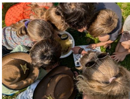
Natuuractiviteiten in bijeenkomsten van Buiten spelen