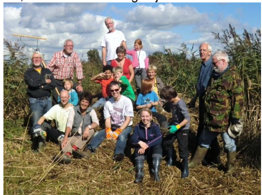
2015 – VLB samen met Ecokids

Genieten van het najaars- of voorjaarszonnetje, in de winter je koude handen en voeten opwarmen bij een vuurtje met een lekkere warme kom soep in de handen. En dan om je heen kijken naar het verrichte werk op die heel speciale mooie plek en naar al die tevreden gezichten; het is een voorrecht.