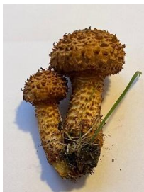
Schubbige bundelzwam & Creativiteit van Bernhard