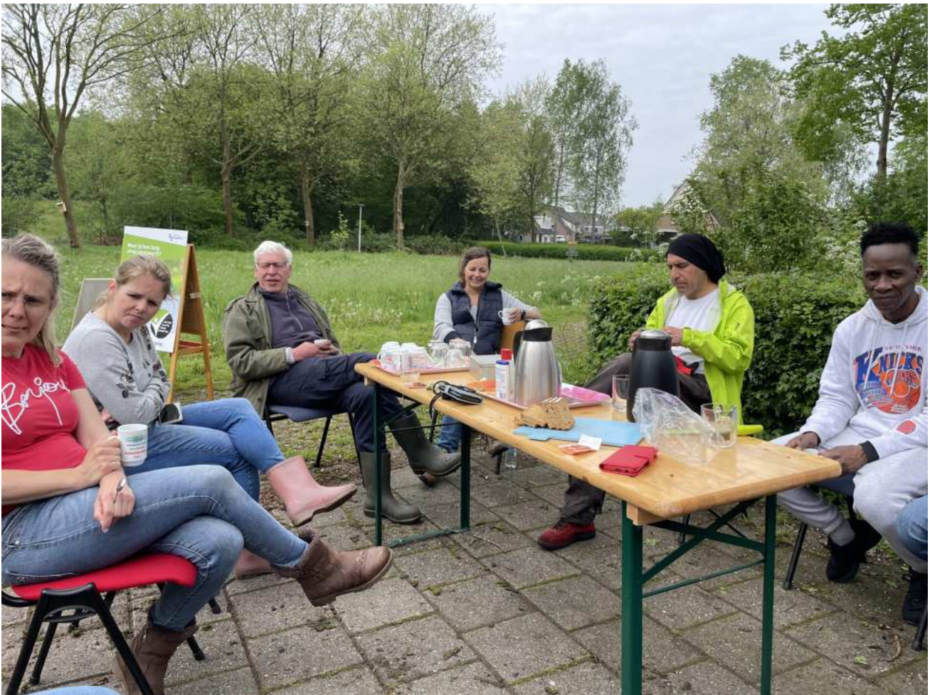
Koffiedrinken met vrijwilligers op de vrijdagochtenden.

https://www.rtvdrenthe.nl/radio/aflevering/koffie-en-keuvelen/95B4087D1684CF6CC1258A4A002726C1