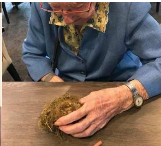
Waar bestaat een vogelnestje uit?