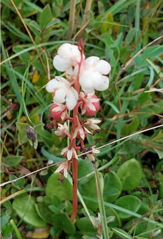
Rond wintergroen