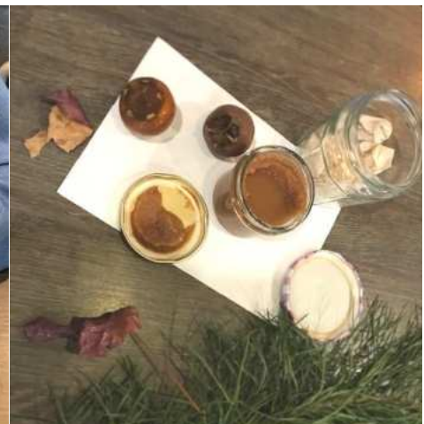
Mispels - Mispelmoes - Den