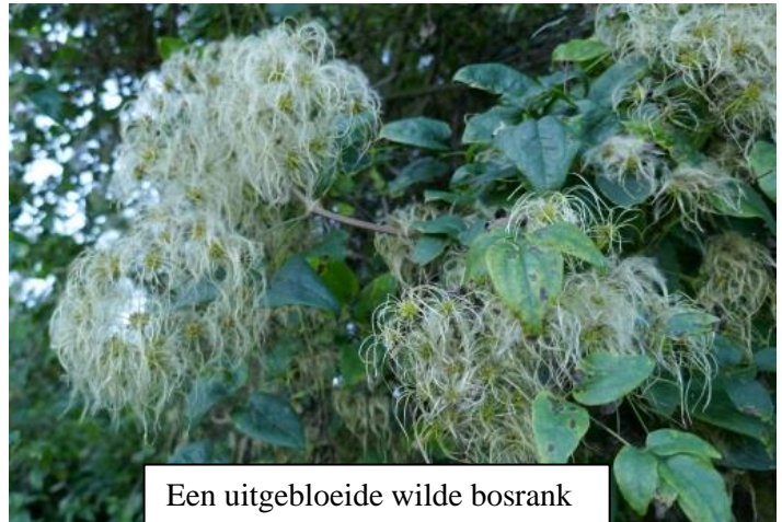
Een uitgebloeide wilde bosrank

De Clematis vitalba of inheemse bosrank behoort tot de giftige Ranonkel-familie, waartoe ook o.a. Boterbloemen en Pioenrozen behoren. De plant kan 15 tot 20 meter hoog worden en valt op doordat ze als een sluier over het struweel of de bosrand (waarin ze staan) groeien. De bosrank hecht zich niet (zoals klimop) maar slingert door en over takken en stammen van struiken en bomen. De bosrank behoort tot de meest forse liaansoort die in ons land en België voorkomen. Ze krijgen in het voorjaar trossen kleine witte stervormige bloemen, uitgroeiend in het najaar tot zaadpluizen, die dan door de wind verspreid worden. De zogenaamde windverspreiding is één van de drie vormen van verspreiding waardoor een plant zich vermeerderd. (de twee andere vormen van vermeerdering zijn verspreiding door contact en water). De Bosrank is een echte kalkindicator en je vind hem vooral daar in Nederland en België waar kalk in de bodem zit, bijvoorbeeld in Zuid-Limburg en de aansluitende gebieden over de grens.