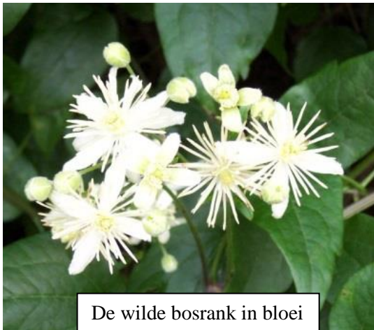
De wilde bosrank in bloei

Op zondag 1 oktober hebben we onder schitterende weersomstandigheden een excursie wandeling gemaakt in de Voerstreek in België. Je zou op zo'n zonovergoten dag soms vergeten dat we al in het najaar zijn aangeland, maar in de natuur is dit op plekken toch al duidelijk zichtbaar. Wij zagen dit vooral aan de vele uitgebloeide bloemen van de Clematis vitalba die waren uitgegroeid tot een mooie pruikebol.