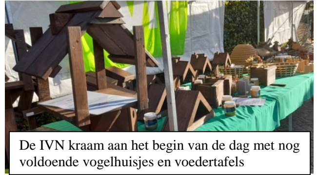
De IVN kraam aan het begin van de dag met nog voldoende vogelhuisjes en voedertafels