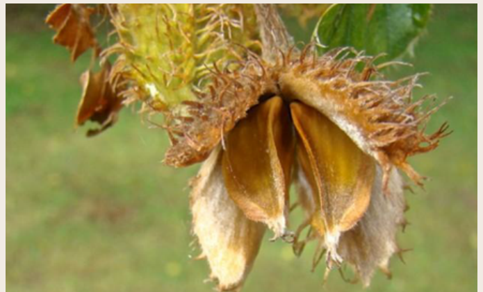
De mannelijke bloemen (foto links) en het napje met beukenootjes (foto rechts)

Na bevruchting ontwikkelen zich in de napjes de beukenootjes. Als de beukenootjes rijp zijn, opent het napje zich in vier delen en vallen de scherp driehoekige beukenootjes op de grond.