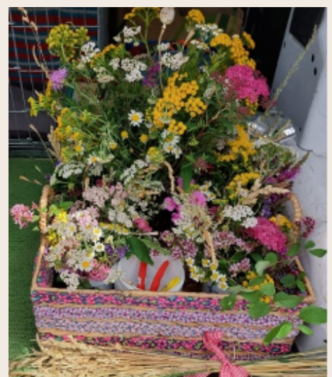
Verzameld materiaal voor een van onze activiteiten.