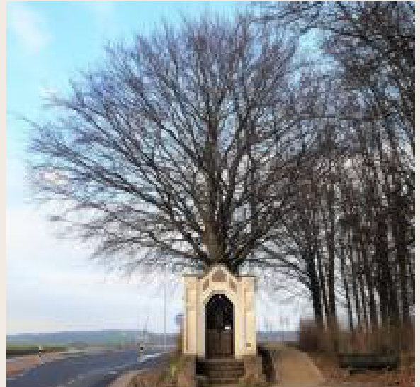
HEILIG HARTKAPEL MET OP DE ACHTERGROND DE RODE BEUK, 2026

De gewone rode beuk heet Fagus sylvatica 'purpurea'. De rode beuk naast de kapel heeft zeer donker blad en is daarom een 'atropunicea'. Onbekend is bij welke gelegenheid de rode beuk hier is aangeplant.