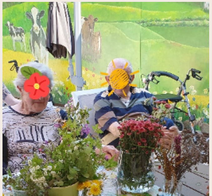
Een van onze buitenactiviteiten in de tuin van de Rode Beuk

En wij mogen een bijdrage leveren door middel van activiteiten op het gebied van natuurbeleving. Met de deelnemers gaan we creatief aan de slag met zoveel mogelijk producten uit de natuur of geven producten een tweede leven. Als voorbeeld onze activiteit vlak voor Pasen.