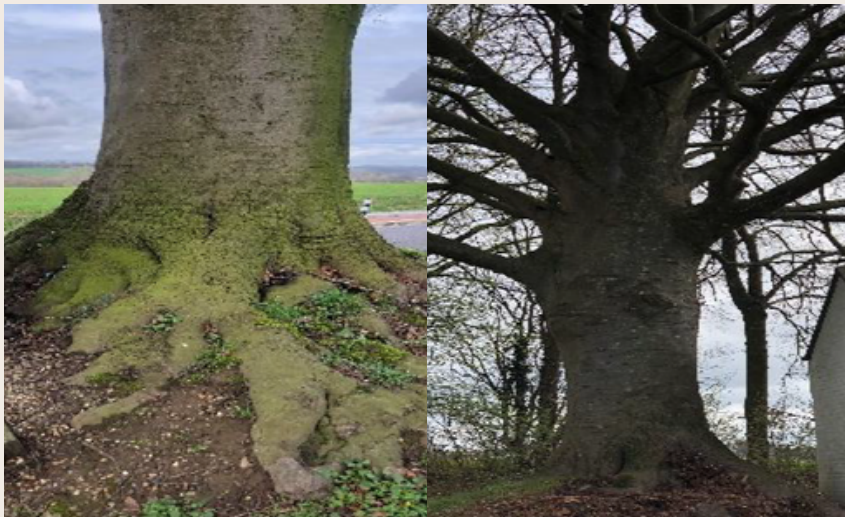
De voet met stam van de rode beuk, 2026

Het is niet voor niets dat de rode beuk zo aantrekkelijk werd (en wordt) gevonden. Ze worden vaak alleen geplant en dan komen de kleur van het blad, de brede kroon en de hoogte goed tot hun recht. Ze zijn dan echt een pronkstuk in het landschap.