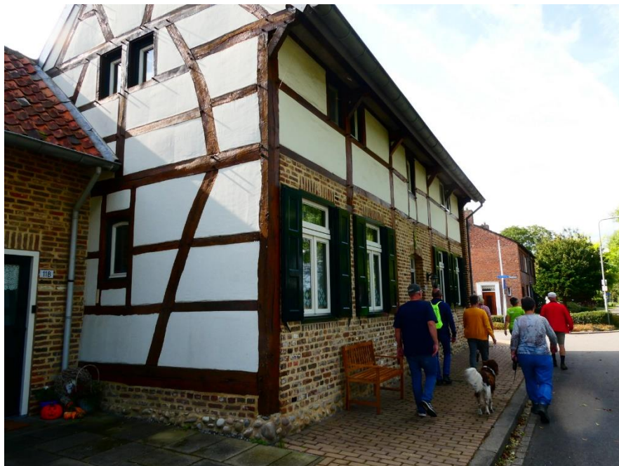
Vakwerk in Partij.

De wandelingen vonden eveneens in de ochtend en middag plaats onder een stralend zonnetje