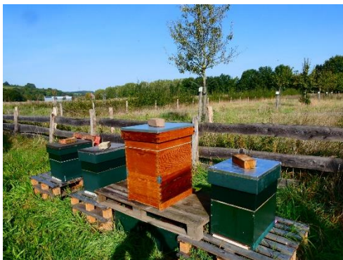
Ook de bijenkasten hebben een plekje in de Fruitwei