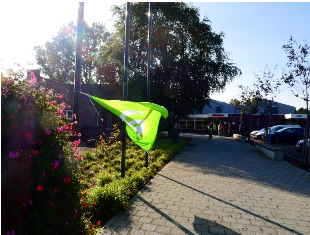
De IVN vlag wappert bij A ge Wienhoes.

Hieronder een foto-impressie van deze dag.