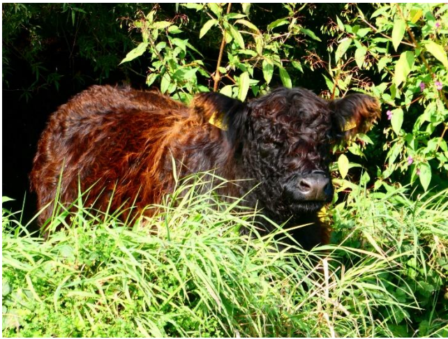
Galloway in de Geulwei.