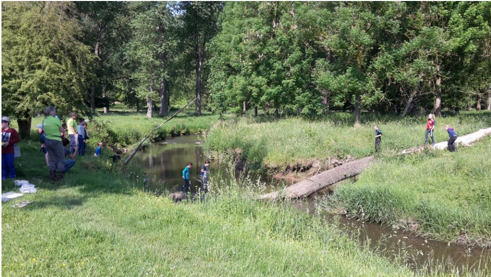
De Geul bij Stokhem

Ook hebben al de nodige struintochten plaats gevonden met leerlingen van de basisscholen van Wijlre, Gulpen en Mechelen.