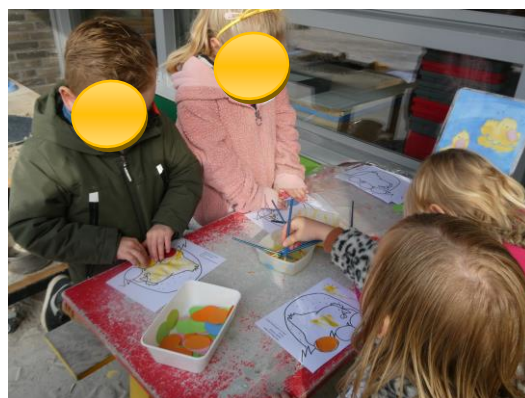
Gekleurde eitjes plakken met eiwit.