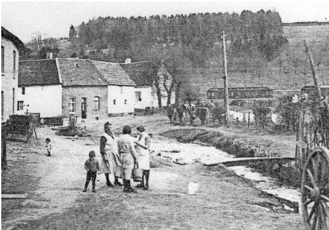
Aan het Veld (A ge Veld) Gulpen, op de achtergrond de Gulperberg en de tram.

Belangstellenden voor de lezing dienen zich uiterlijk 5 juni a.s. aan te melden middels een mail aan debongard@hotmail.com . Voor leden van heemkundevereniging De Bongard is de toegang gratis, van niet-leden wordt een bijdrage gevraagd van 3 euro.