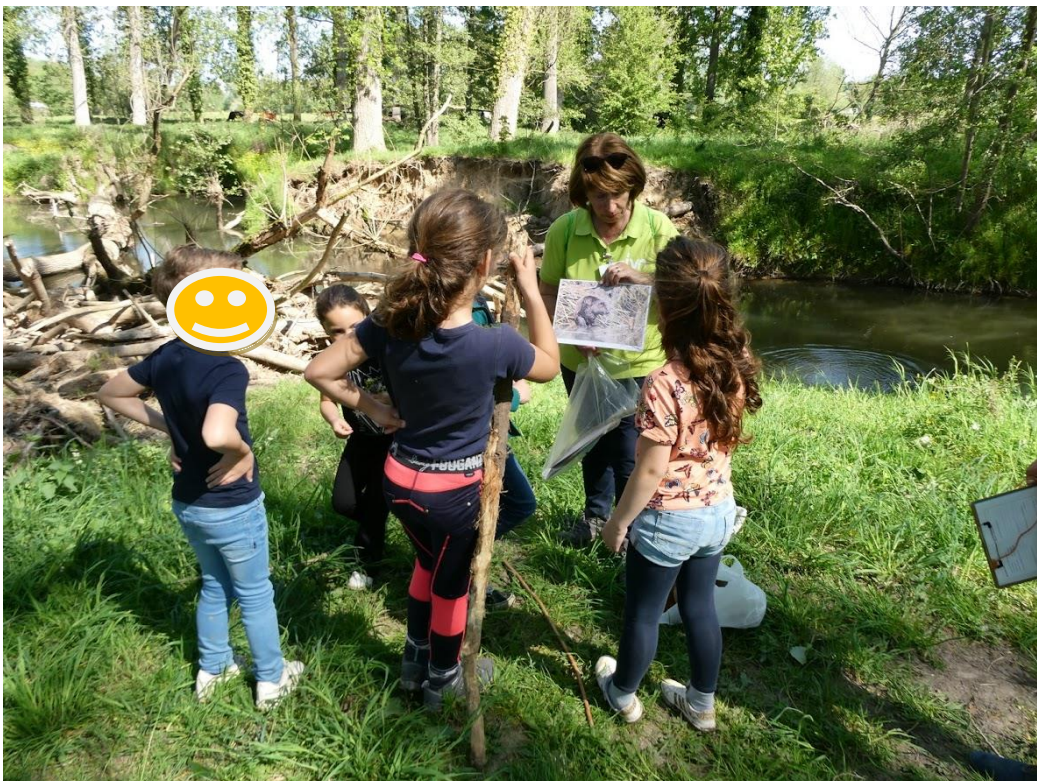
De bever ontdekken.

Mocht u interesse hebben in vrijwilligerswerk met onze schoolkinderen, meldt dit dan aan ons secretariaat. secretaris@ivn-heuvelland.nl