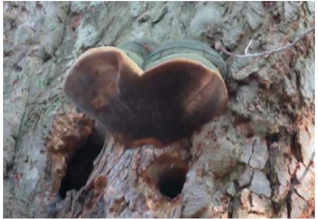
Eikenvuurzwam