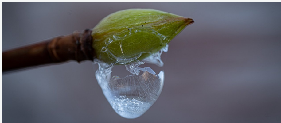
ijsbal aan takken hortensia