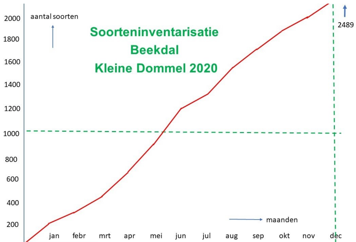
Grafische ontwikkeling aantal waargenomen soorten