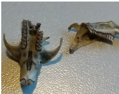
Schedel rosse woelmuis

Behalve dan die keer dat ik muurvast zat in de modder en uiteindelijk op mijn sokken het moeras uit ben gekomen, mijn fiets met een lekke band aantroef en op mijn natte sokken naar huis moest lopen.