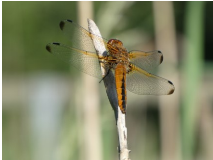
Bruine rombout

Maar ook de smaragdlangsprietmot, gewone schorpioenvlieg, zwartvlerkbladjager, bruine korenbout, brede orchis en de boekenschorpioen vond ik bijzondere waarnemingen.