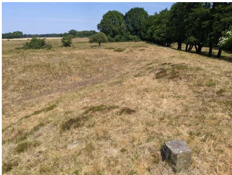
Arrier Koeland. Zeer droog Rivierduingrasland in Juni