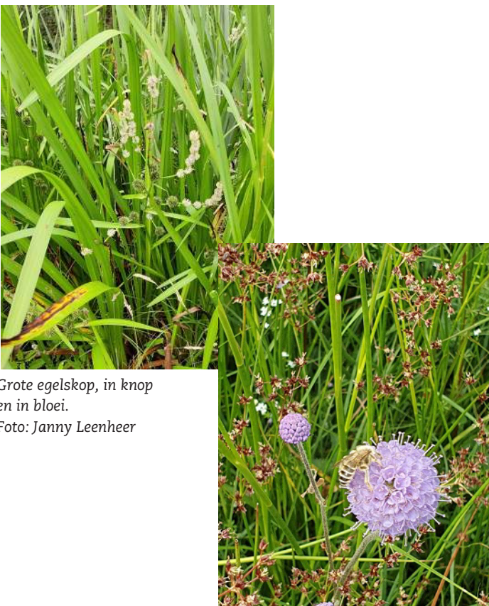
Grote egelskop, in knop en in bloei.