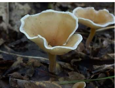
Bleekrandtrechterzwam ( Clitocybe marginella )