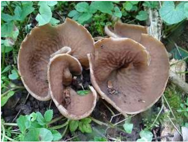
Grote aderbekerszwam ( Disciotis venosa )

Dit jaar zijn we voor het eerst ook in het voorjaar op zoek gegaan naar paddenstoelen. De tocht ging op 18 april naar de Tichelgaten in Wijhe. Doordat de grond daar klei bevat vind je daar paddenstoelen die je in onze omgeving op de zandgronden niet vindt. We vonden tientallen Grote aderbekerszwammen ( Disciotis venosa ), Kapjesmorielje ( Mitrophora semilibera ) en Vingerhoedjes ( Verpa conica ).