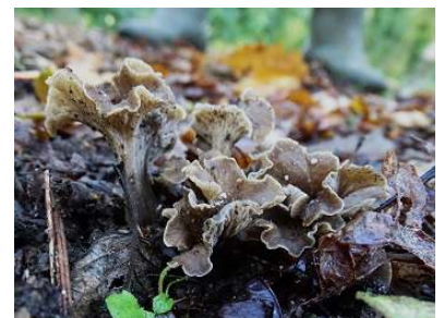
Kleine trompetzwam ( Pseudocraterellus undulatus )

Ieder jaar gaan we begin november naar het Arriër Koeland, omdat daar de kans op wasplaten groot is. We vonden dit jaar negen verschillende soorten wasplaten waaronder de zeldzame Apothekers wasplaat ( Hygrocybe nitrata ). Ook vonden we verscheidene Gordijnzwammen en de Witte- en Sikkelkoraalzwam.