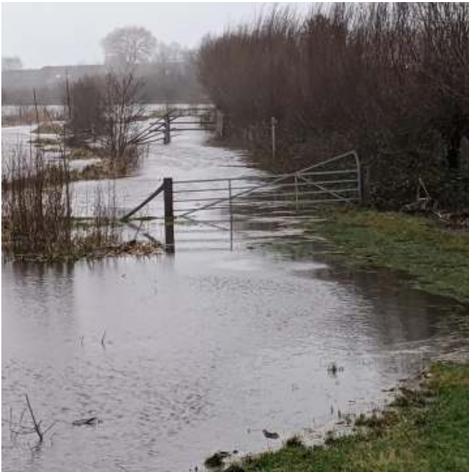
Wateroverlast in hardenber

Het natte najaar en winter zorgden voor veel overlast en maakte het werken in de natuur voor de natuurwerkgroep er niet gemakkelijker op en zelfs zo nu en dan onmogelijk. Veel gebieden stonden onder water en zelfs het werk op de gemeentewerf kon daardoor een aantal keren niet doorgaan. De natuur ging haar eigen gang en wij konden het lijdzaam aanzien. Gelukkig is de draad weer opgepakt en mogen we de mouwen opstropen om voor het broedseizoen enkele grote klussen te kunnen uitvoeren.