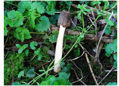
Vingerhoedje ( Verpa conica )

Doordat we een natte zomer hadden zijn we ook een paar keer in augustus op pad geweest. In Collendoorn vonden we op 8 augustus de Bleekrand trechterzwam ( Clitocybe marginella ). Vanaf één september tot eind november hebben we iedere dinsdagochtend paddenstoelen geïnventariseerd. Alle waarnemingen worden ingevoerd op waarneming.nl en eventueel ook naar de beheerder van het terrein gestuurd.