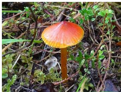
Duinwasplaat ( Hygrocybe conicoides )