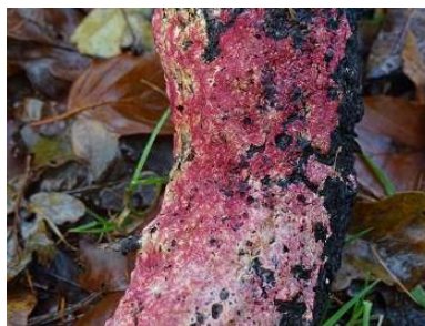
Hangende zwameter ( Hypomyces rosellus )