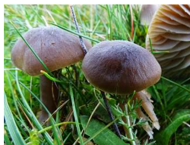
Apothekerswasplaat ( Hygrocybe nitrata )

De laatste excursie was op 28 november naar Boswachterij Hardenberg, Koehaar. Het had al gevoren en diverse paddenstoelen waren bevroren, maar goed herkenbaar. Totaal vonden we 61 soorten waaronder de Hangende zwameter ( Hypomyces rosellus ) en heel veel Groene glibberzwammen ( Leotia lubrica ).