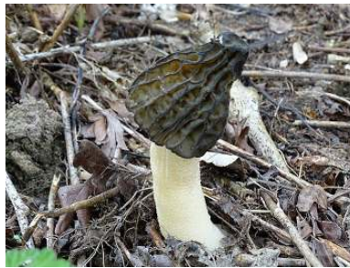
Kapjesmorielje ( Mitrophora semilibera )