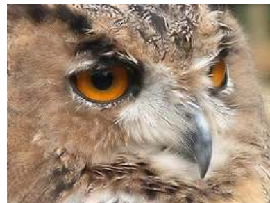
Detail van de kop

Tekst: Gert Diepeveen