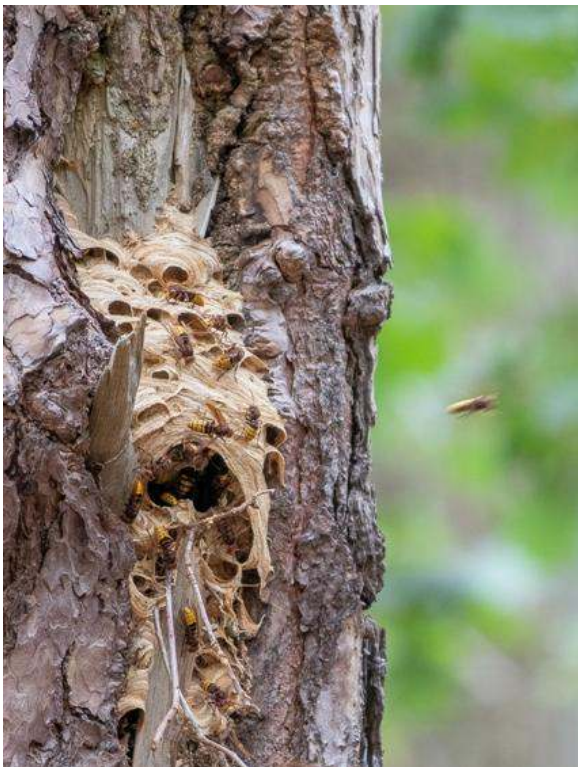
Een hoornaarsnest, gefotografeerd in de Loonse en Drunense duinen