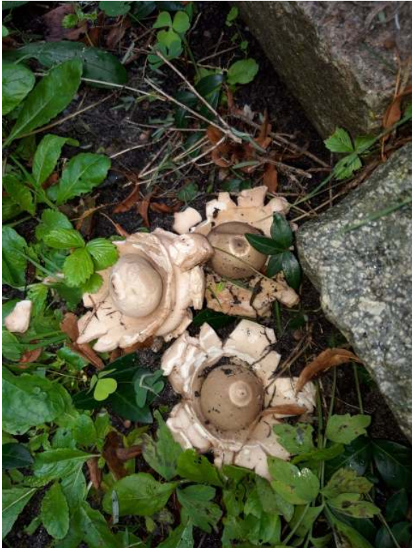
Gekraagde aardster bij Harry in de tuin.