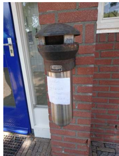
Koolmees nestelt in asbak