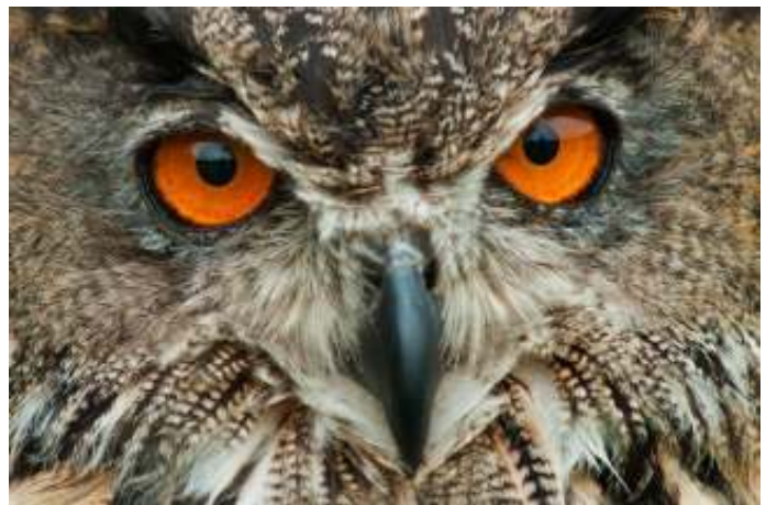
Felle oranjerode ogen en een grote kop, dat zijn belangrijke kenmerken van de oehoe