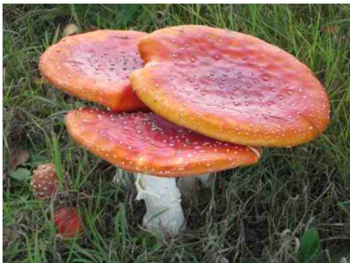
Oude vliegenschwammen, de jonge exemplaren verschijnen alweer

Lydia de Waard-Levöleger, Paddenstoelen werkgroep