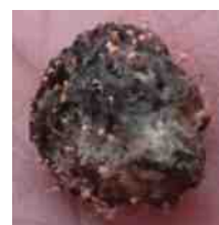
roze mestknopsteeltje, Stilbella erythrocephala .