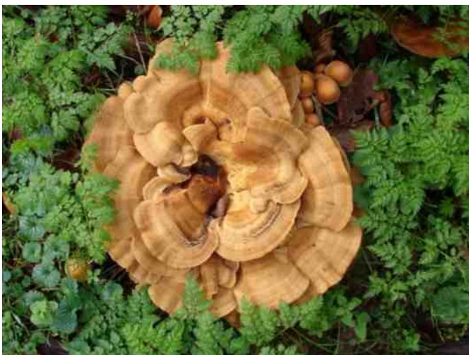
Reuzenzwam. Deze zitten altijd op beschadigingen van loofbomen, vaak beuk en eik