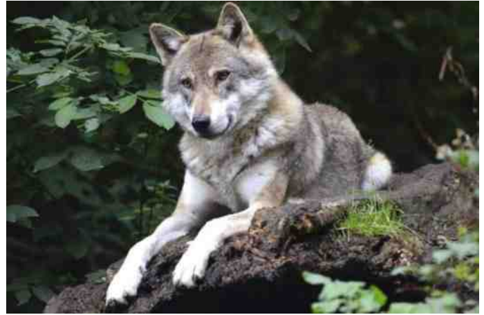
Een grote boze wolf???