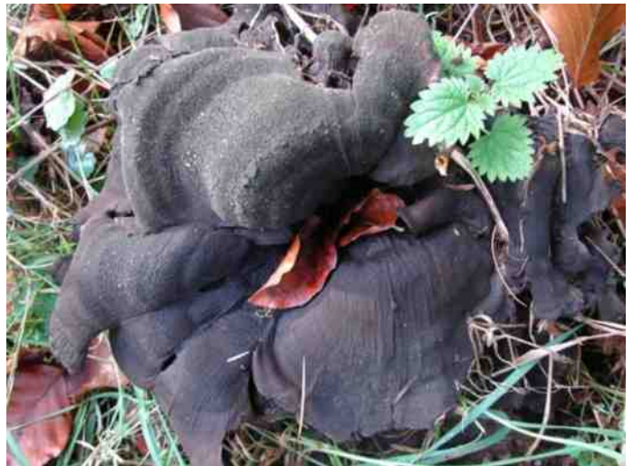
Reuzenzwam, heel oud