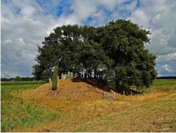
Het Jodenbergje in het Vechtdal.