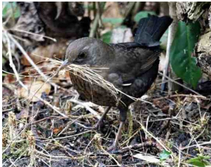
Merel met nestmateriaal.