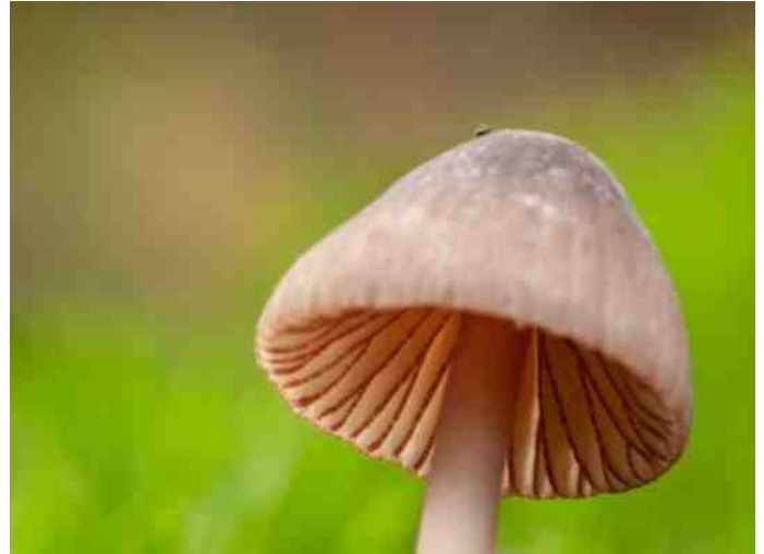
De hoed van een mycena.