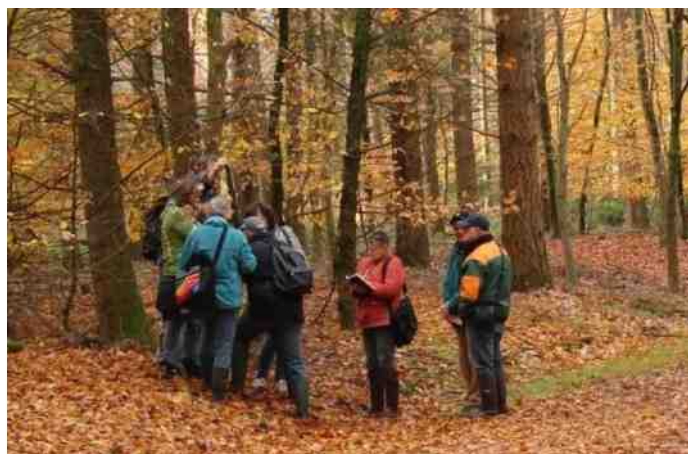
De paddenstoelenwerkgroep in het bos

Tekst en foto's: Gert Kremer, lid paddenstoelenwerkgroep