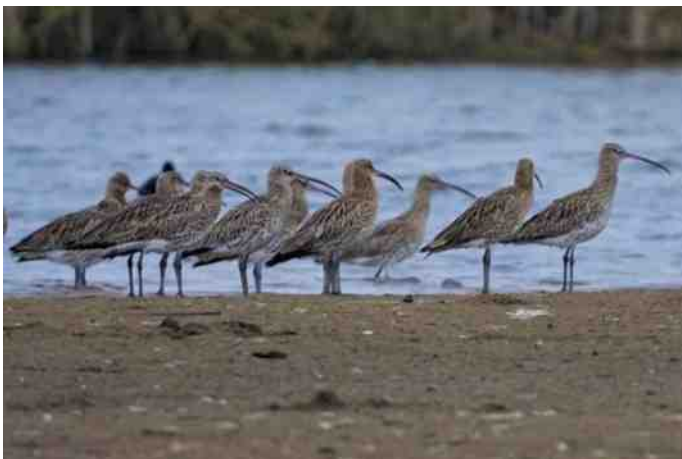
Wulpen in het Vechtpark

'De wulp kijkt naar zijn gulp': een bekend ezelsbruggetje om de wulp aan zijn kromme, naar beneden gebogen snavel te kunnen herkennen. Het is de grootste steltlopersoort en geliefd om zijn prachtige, jodelende baltszang. De prachtige wulp is een kust- én weidevogel. Uit de nieuwe Vogelatlas die november 2018 werd gepresenteerd, blijkt dat het met kust- en weidevogels niet goed gaat in Nederland. De oer-Hollandse wulp is dus op twee fronten de klos. Hij staat hoog op de Rode Lijst. Hulp voor de wulp is nodig. Reden voor Sovon en Vogelbescherming om 2019 uit te roepen tot het Jaar van de Wulp.