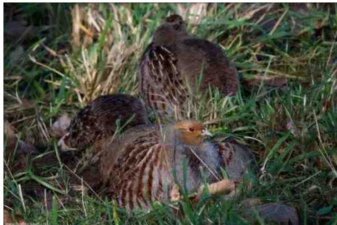
Patrijzen in het Vechtpark.