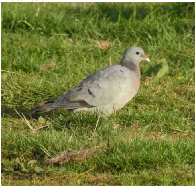
Holenduif in het Vechtpark

Tekst en foto's; Julian Overweg, coördinator werkgroep Nachtvinders