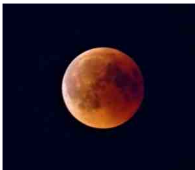
Bloedrode maan van 2018.