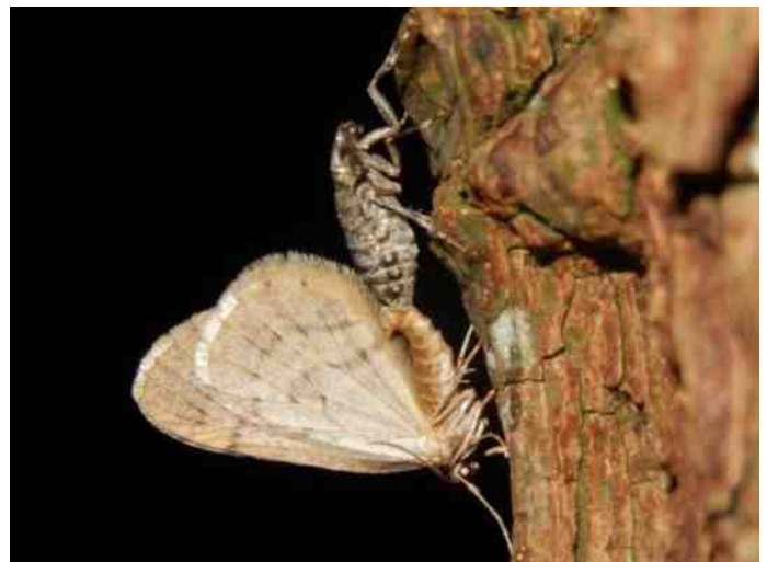
Man en vrouw kleine wintervlinder parend

Tekst en foto: Kars Veling, de Vlinderstichting