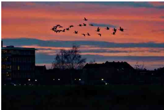
Gezinnen op weg naar hun slaappleafts in de avond.