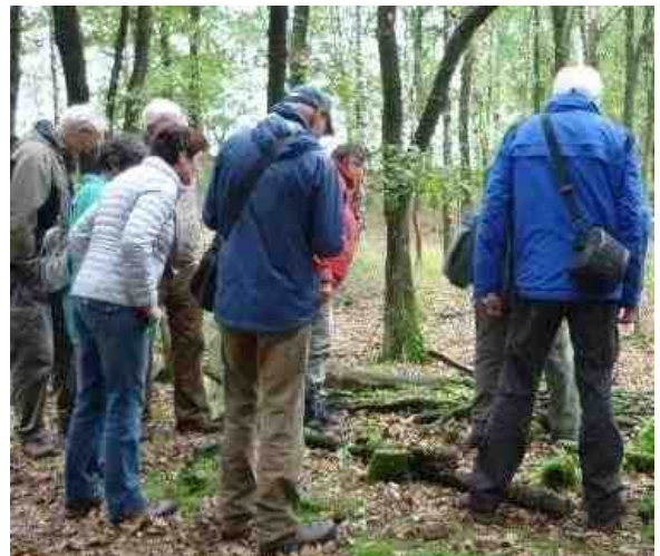
De groep belangstellenden