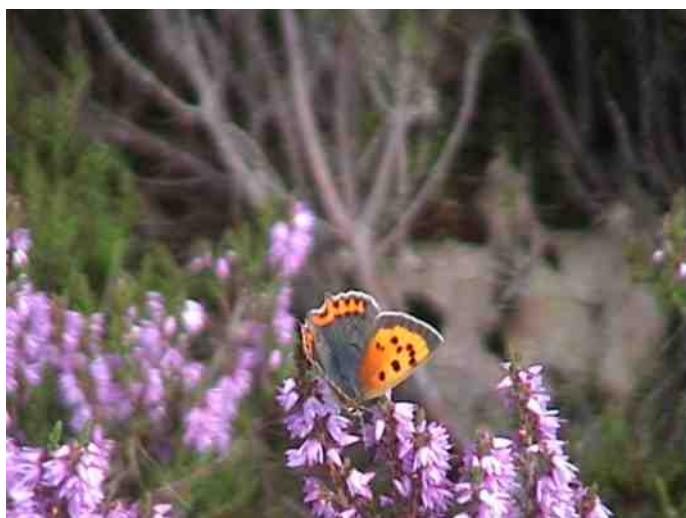
De Vuurvlinder op heide

Let op de berichtgeving via de mail of in de media!!