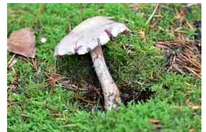
De Kamfergordijnzwam en de zeldzame soort van de Olijplaatgordijnzwam