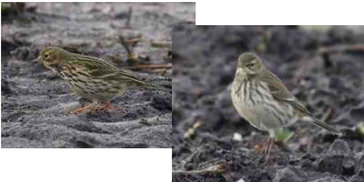
Graspieper en Waterpieper

Foto's en tekst: Bert Stegeman en Julian Overweg (bewerkt door de redactie)