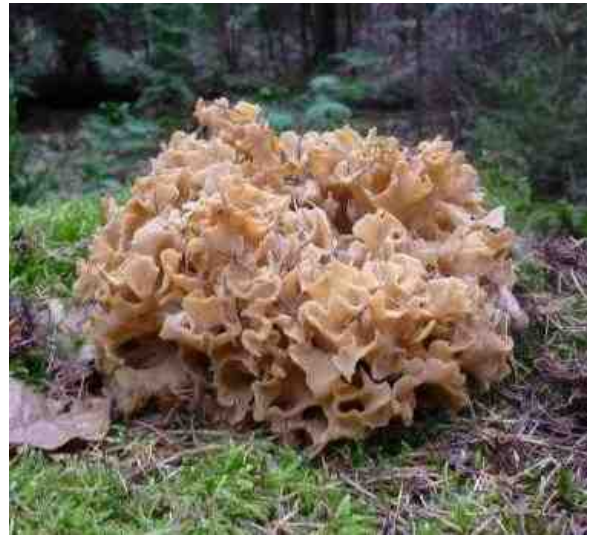
De Grote sponszwam