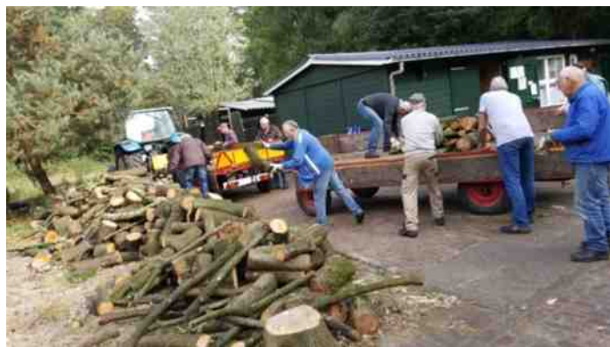
De groep aan het werk