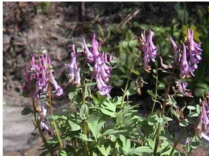
De Holwortel in bloei

Daarnaast worden meerdere natuurwandelingen en -fietstochten georganiseerd voor ouderen en mensen met een beperking. In 2018 hebben we ook een actieve uitwisseling met IVN Den Ham.