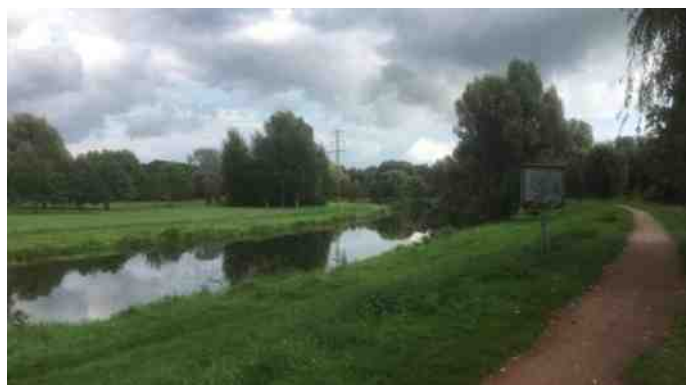
Rivier de Vecht bij Schutterf