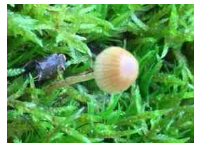
Mosklokje op mos en onder de microscoop