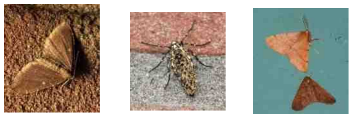
Vlinders die op licht afkwamen