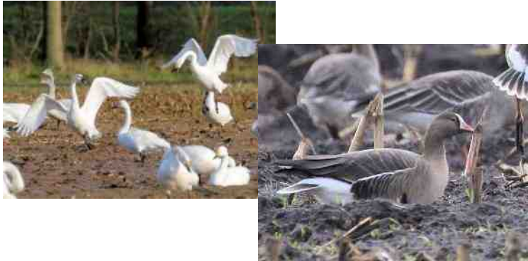
Zwanen en de Dwerggans

Dwerggans tussen de rietganzen. Deze zat in november aan de Broekdijk bij Bruchterveld tussen enkele duizenden toendrarietganzen. Dwergganzen staan als zeldzaam te boek.