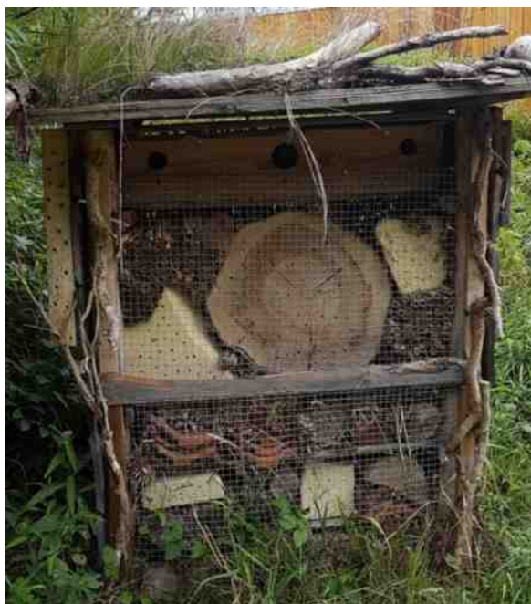
Bijenhoteis van IVN Schinnen