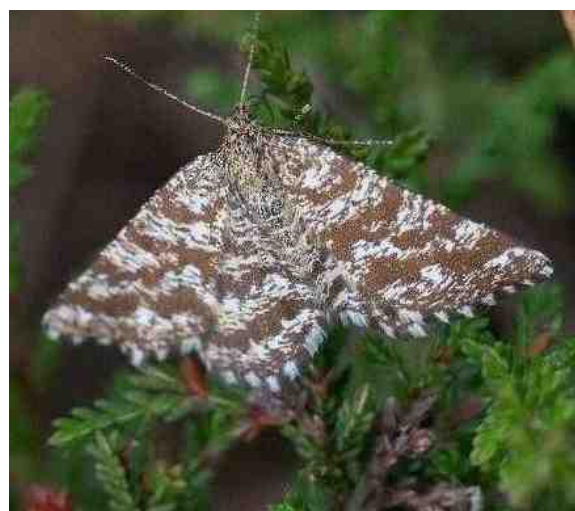
De gewone heispanner

Het was niet echt de beste tijd om adders te zien. Voor het spotten van reptielen zijn het voor- en najaar de beste tijd. Een heikikker sprong nog wel weg, maar werd even gevan-