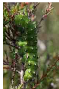
Rups van de nachtpauwoog