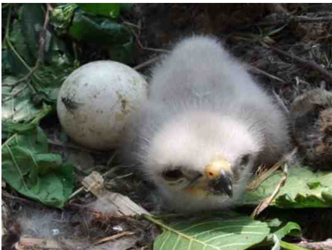
De baby buizerd kijkt verbaasd de wereld in

Tekst en foto's: Jan Leferink, IVN-lid, roofvogel expert