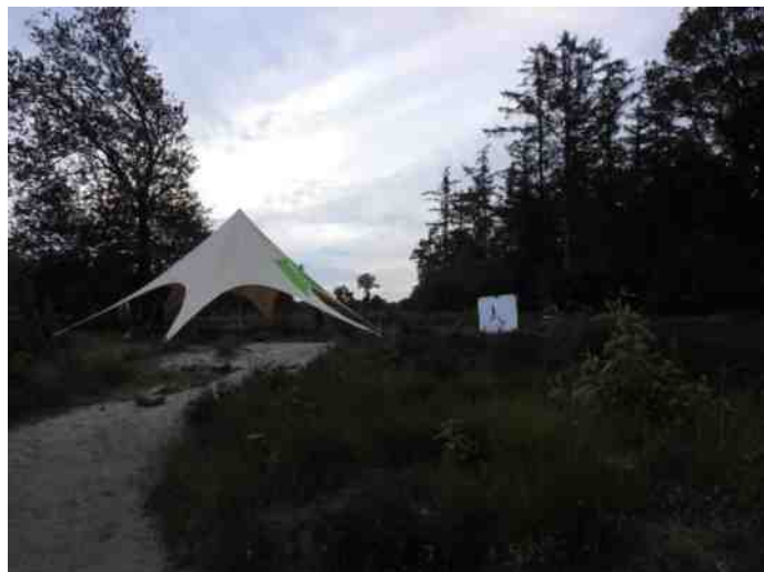
De tent van staatsbosbeheer