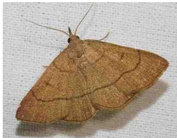
De gele snuituil