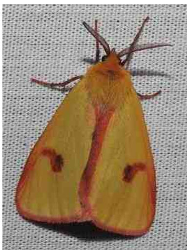
De mooie roodbandbeer