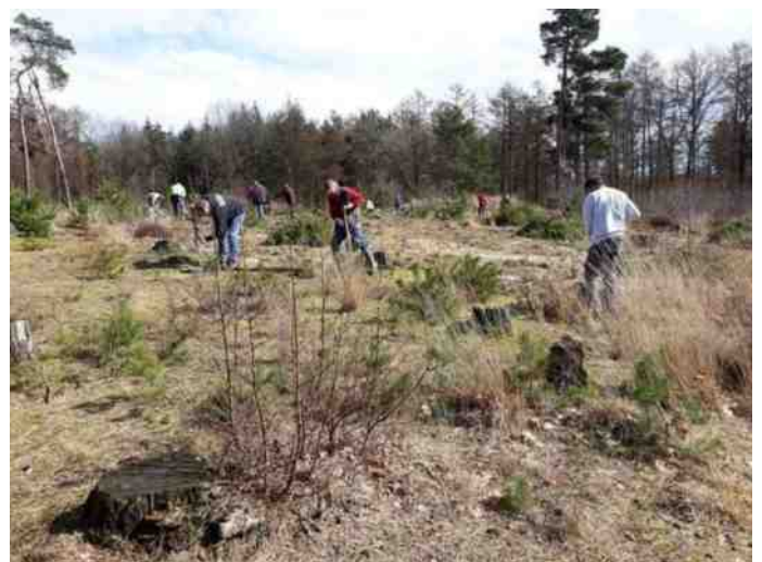
Mensen van het landschapsonderhoud in het veld