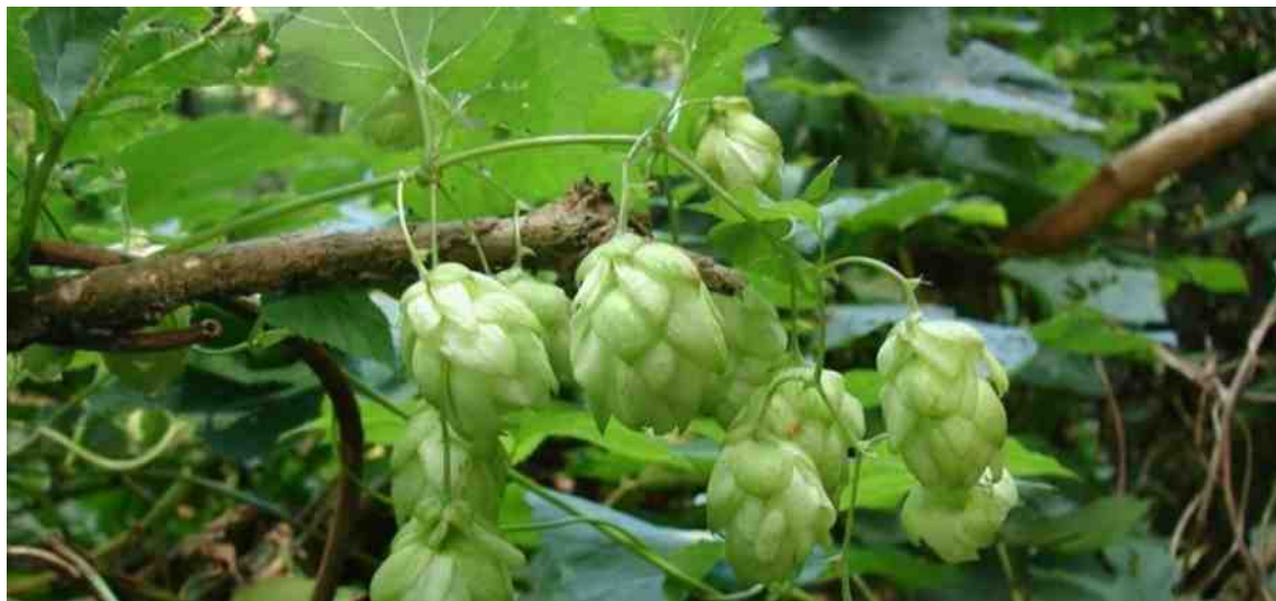
Hop in bloei