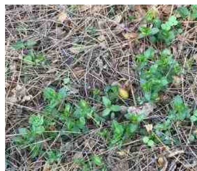
De verdorde maagdenpalm laat weer groene blaadjes zien