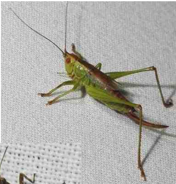
Het gewoon spitskopje