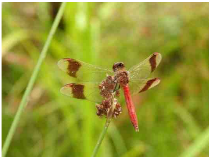
De zeldzame bandheidlibel bij de oevers van de rivier de Vecht