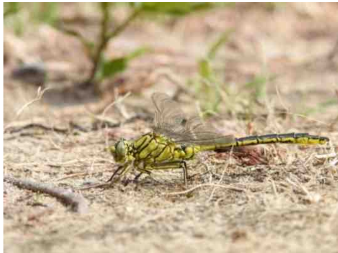
De ook zeldzame plasrombout werd gezien in het gemeentebos in Hardenberg

Tekst en foto's: Sylvia de Vries, IVN-lid