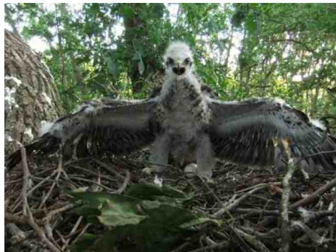
De tiener buizerd wil de wijde wereld in