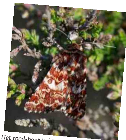
Het rood-bont heideuiltje