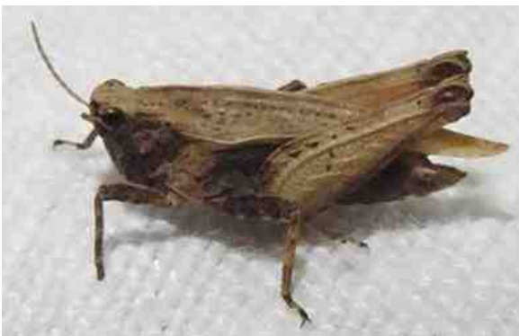
Het gewoon doortje