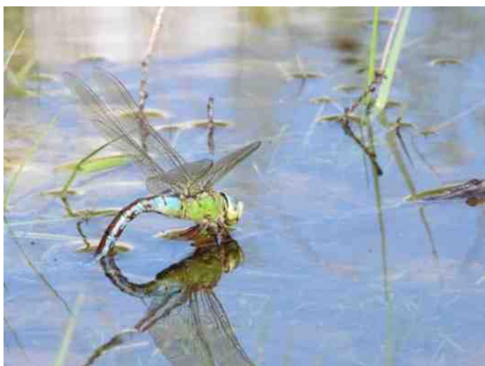
De doodnormale grote keizerlibel ergens in de boswachterij van Hardenberg