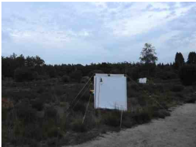
De lakens en lampen staan klaar