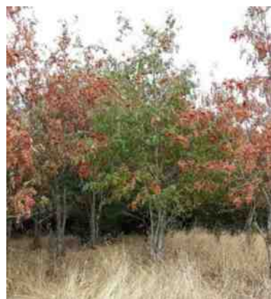
Droge zomer in Collendoorn

Tekst: de redactie