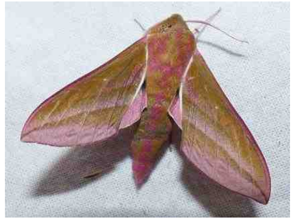
Het groot avondrood

Tekst en foto's: Anneke Leferink, lid werkgroep Nachtvinders