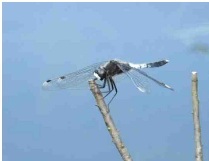
En de sierlijke witsnuitlibel, die zeer zeldzaam is, werd gesignaleerd in de boswachterij van Hardenberg