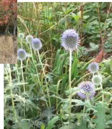
De kogeldistel staat in de nazomer weer in bloei ondanks de droogte.