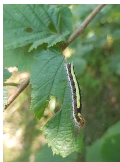
Rups van de Psi-uil