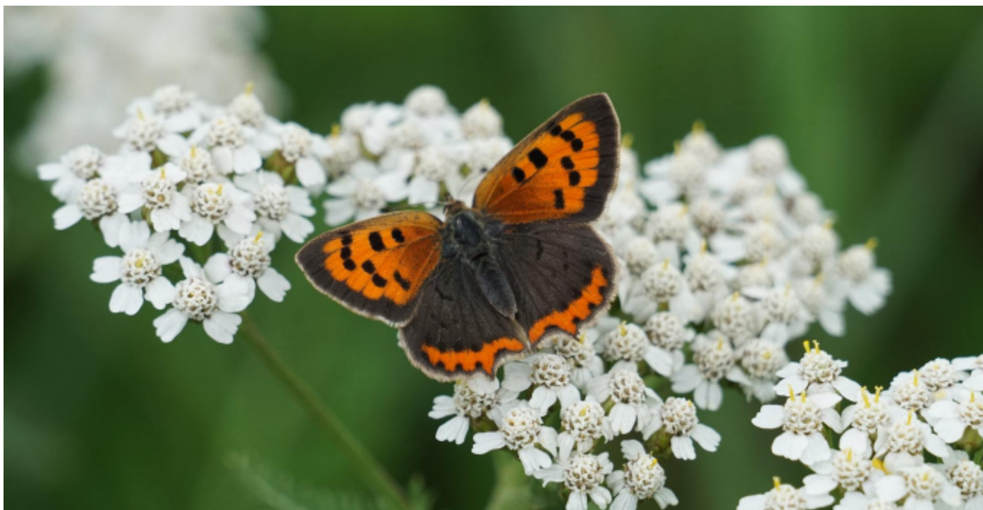
Kleine vuurvliinder.