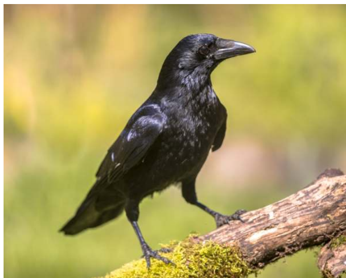
Tekst: Wiebe Tolman.

Kijk op het filmpje: Smart crows in Japan.