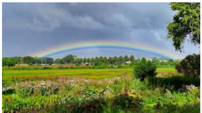
Zicht op Hardenberg.