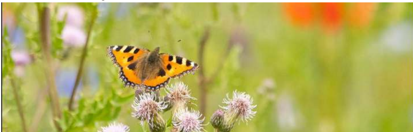
Kleine Vos.