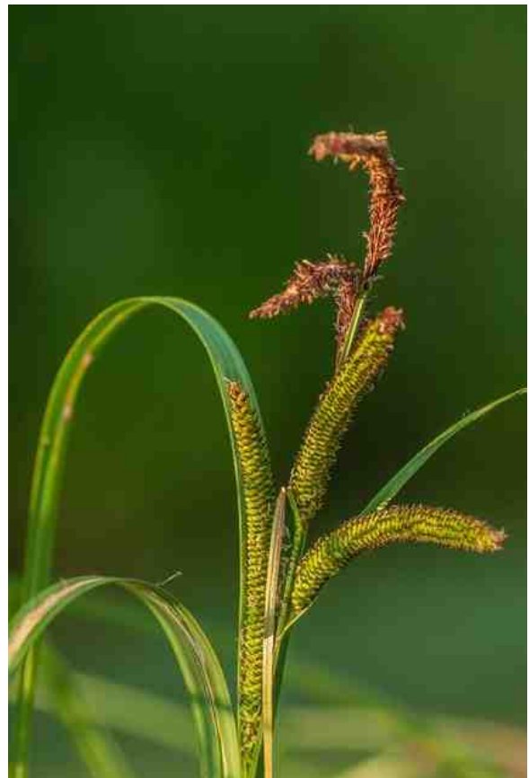
Een zegge soort in de Rheezermaten