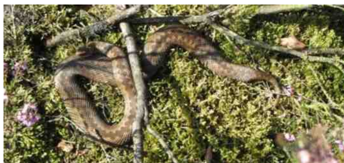
Zonnende vrouwtjes adder