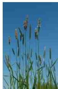
Gras in bloei