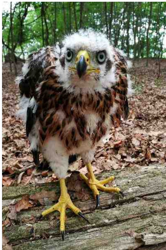
Een jong havik.

Tekst: Bert Jonkhans en Jeanne-Marie Leferink