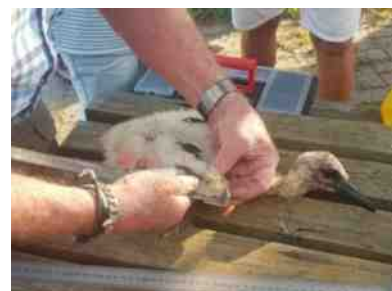
Het jong wordt geringd