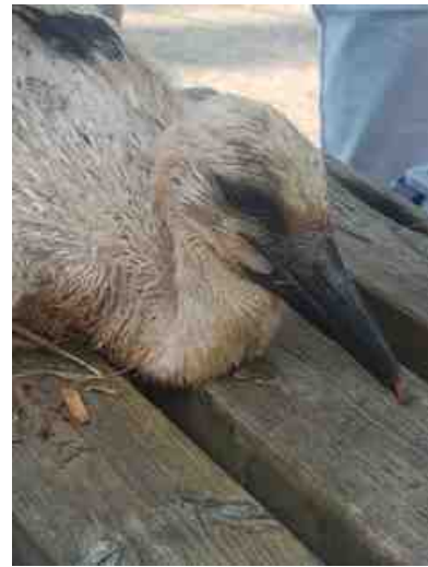
Een verbaasd kijkende jonge ooievaar