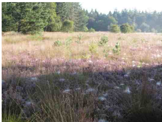
Eén van de vier heideterreinen, vak 11