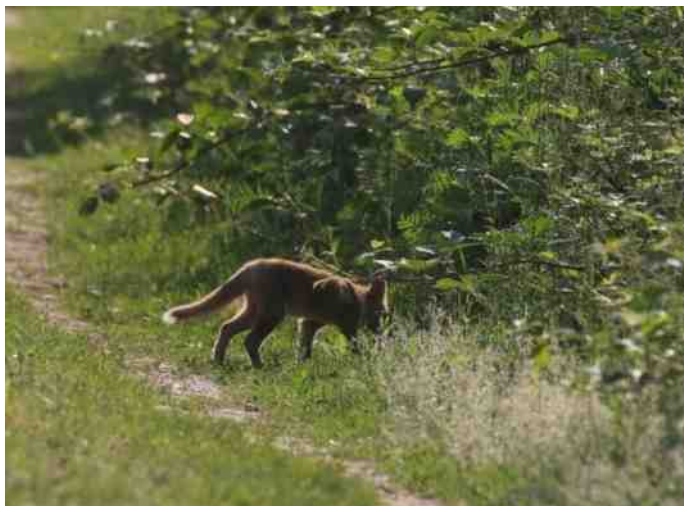
De beleving in beeld van Bert