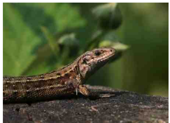
Ben ik in blijde verwachting??