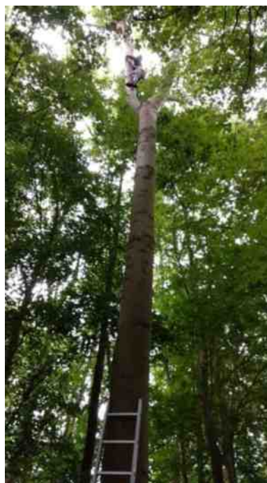
Klimmen in de boom