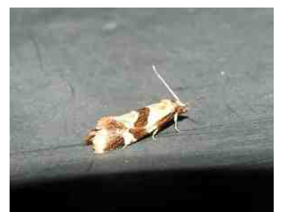
Triangelbladroller - Aethes triangulana