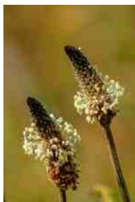
Weegbree in bloei