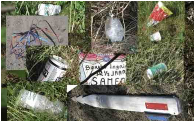
Souvenirs langs het fietspad

Tekst: Henk van Duuren