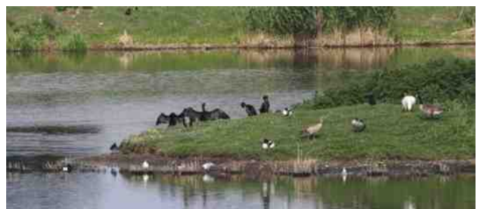
De vloevelden met de vogels

Tekst en foto's: Bert Stegemans, lid Vogelwerkgroep