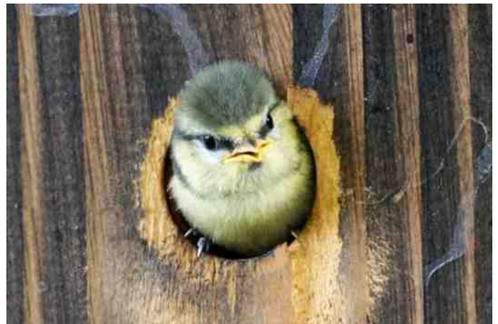
Nieuw leven