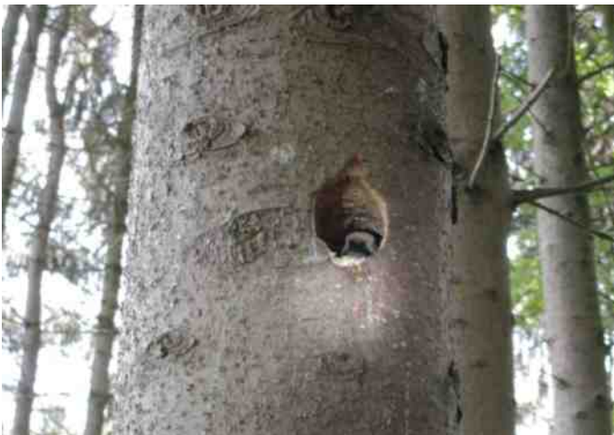
Bonte specht.