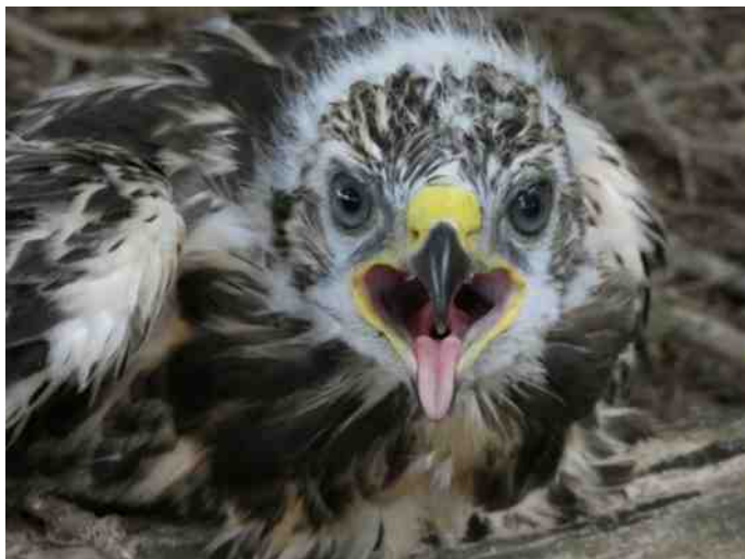
Een jonge buizerd